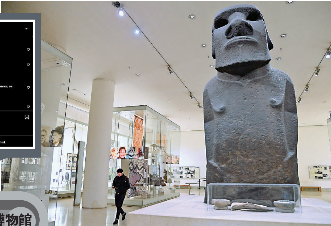
大英博物館展出的「尊復活節島摩艾石像」。