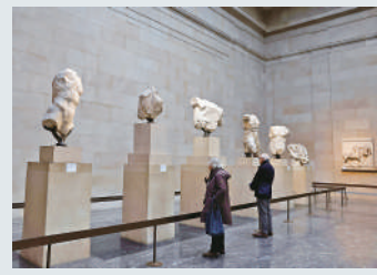
大英博物館中的帕特農神廟雕塑。

希臘於1983年首次正式要求歸還帕特農神廟雕塑，被英國拒絕。去年11月，希臘總理米佐塔基斯親自前往英國談判，不料英國首相蘇納克直接取消了與希臘總理的會晤。英國方面稱，每年有來自世界各地的400萬人在大英博物館參觀這些石像，並不打算將其歸還希臘。