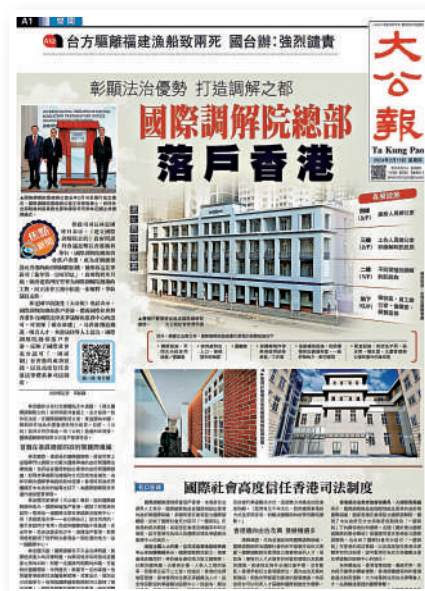
港▶《大公報》早前報道，國際調解院總部將落戶香港。

國際調解院將是一個由各方共同協商建立的、以條約為基礎的政府間國際法律組織，致力於專門提供調解服務，為各類國際爭端提供友好、靈活、經濟、便捷的解決方案。國際調解院是對現有爭端解決機構和爭端解決方式的有益補充，將為和平解決國際爭端提供一個新的平台。