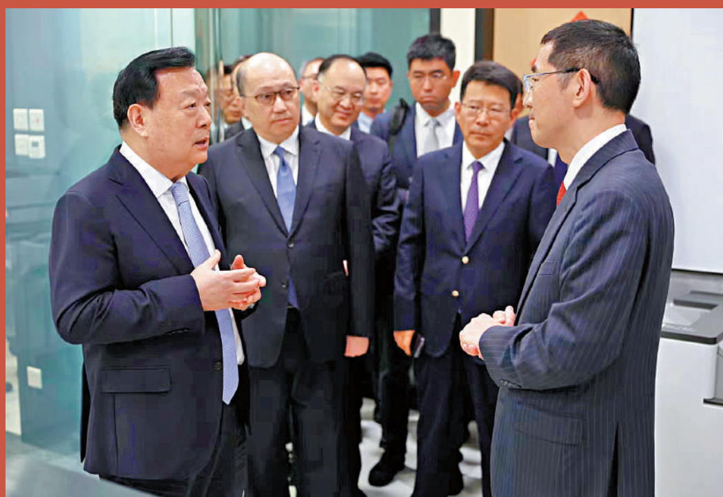
夏寶龍主任（左一）在國際調解院籌備辦公室聆聽籌備辦公室主任孫勁博士（右一）介紹國際調解院的籌備工作和進展。