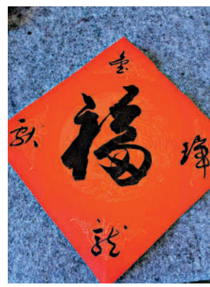
大文集團「福」字徵集活動優勝作品。