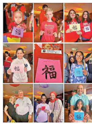
美國飛龍傳媒提供的海外友人「福」字合集。

此次活動旨在弘揚中華文化、促進海外華人華僑交流和團結，同時也希望通過此活動向廣大華人華僑傳遞新年美好的祝願與祝福，以一「福」賀萬「福」！