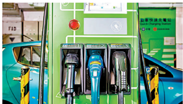
在政府政策推動下，電動車愈趨普及，減低廢氣排放，改善空氣質素。

保障公眾健康，政府自2008年4月1日起，寬減環保商用車的首次登記稅，以鼓勵商用車車主選用排放性能比當時法定廢氣排放標準更佳的環保商用車。環保署每年按汽車科技發展情況、市場供應情況及當時法定的首次登記車輛廢氣排放標準檢討環保商用車的認可標準。