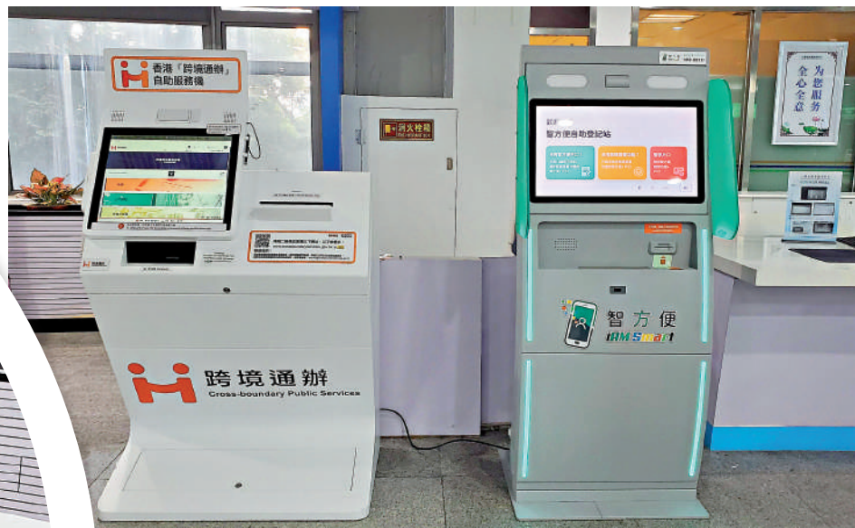
「跨境通辦」自助服務機（左）的同一地點亦設有「智方便」自助登記站（右），辦理「智方便+」的登記或升級手續。

有本港立法會議員認為，「跨境通辦」可為兩地民眾提供極大的便利，希望兩地政府能持續擴大服務範圍。有居內地港人形容措施大大拉近了粵港之間距離，通過數據代替跑腿，實現辦理政務服務時「零出關」快捷辦。