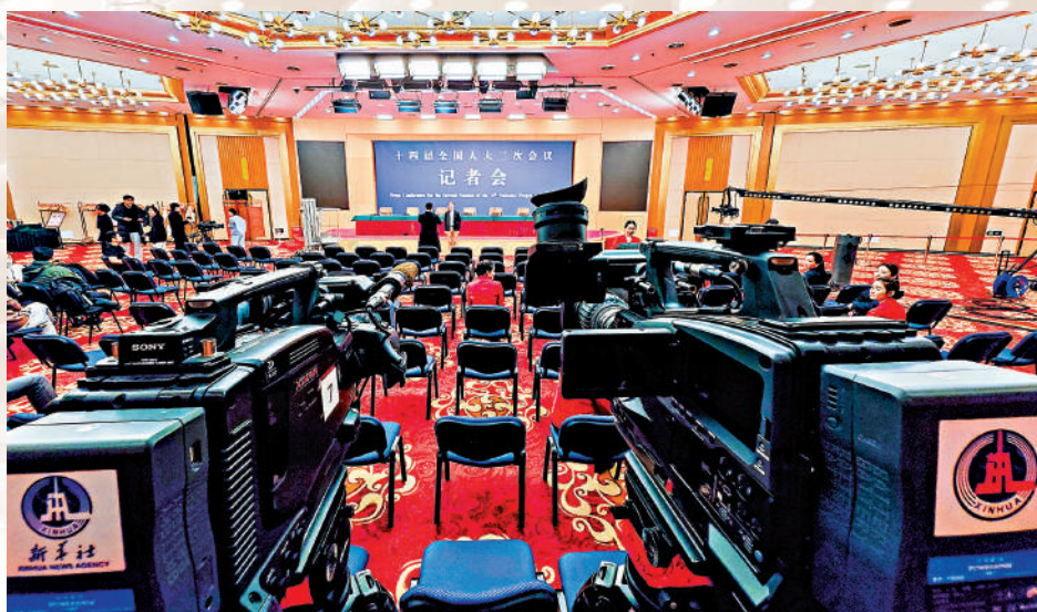
相關新聞刊 A2·A3 十四屆全國人大二次會議將於3月4日在人民大會堂新聞發布廳舉行新聞發布會。

今年，香港大公文匯傳媒集團派出重兵，精心組建由50名精兵悍將組成的報道隊伍，在北京全程直擊，深入報道兩會盛況。通過全媒體矩陣傳播，將持續以港媒角度，向香港社會傳遞兩會的聲音，用充滿細節和溫度的新聞作品，多角度、融媒體、移動化地呈現兩會的精彩瞬間，為香港市民打造一個全方位、多角度觀察兩會的窗口。