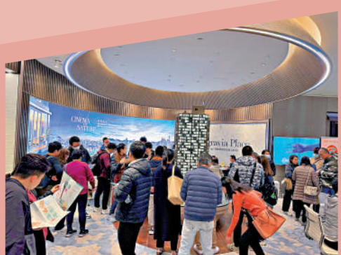
長沙灣新盤連日來登記量暴增，大批買家湧到售樓處入票。

搶開開售 撒辣後頭炮新盤登記反應踴躍。恒地(00012)旗下長沙灣Belgravia Place昨晚截止登記認購，連日累收4400票，相對今日發售的138伙超額31倍。Belgravia Place瞄準時機，在全面撒辣前搶開開價，盡收撒辣效應，連日來登記量水漲船高，大量買家趁昨日最後一日衝刺，紛紛湧到售樓處入票，全場供買家填表入票的登記枱，座無虛席，「爭枱」入票的熱鬧場面屬近年罕見。