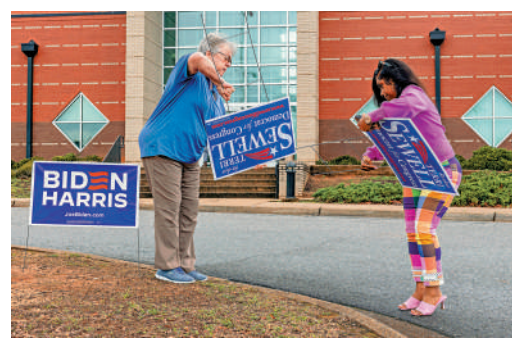
▲美國獨立選民被初選制度排除在外。圖為亞拉巴馬州民主黨官員5日為初選做準備。美聯社

【大公報訊】據美聯社報道：美國選民抱怨，初選制度存在缺陷，剝奪了獨立選民和初選時間靠後地區選民的發言權。美媒指出，在美國初選制度下，總統候選人實際上是由一小部分選民決定的，這讓美式民主受到質疑。