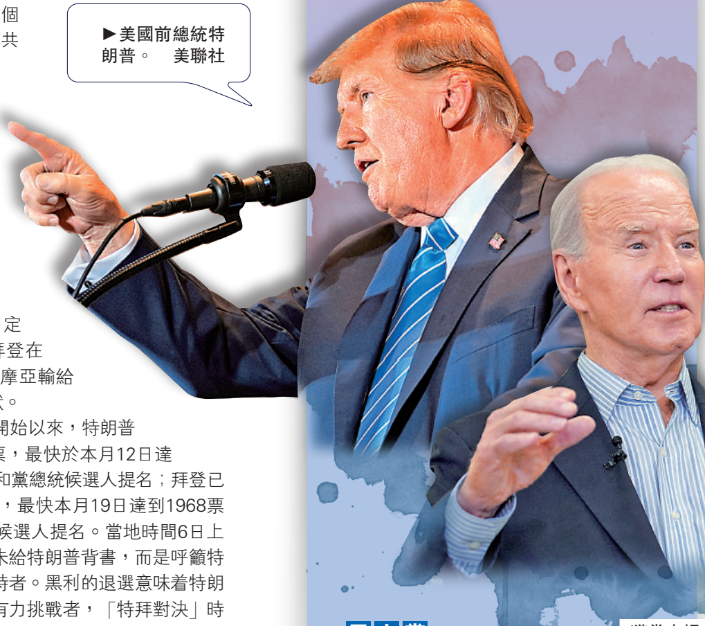
▶美國前總統特朗普。