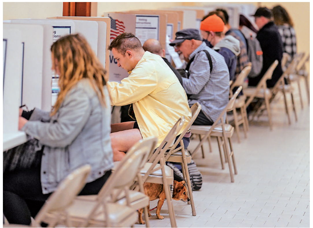
▲加州選民5日參加「超級星期二」初選投票。