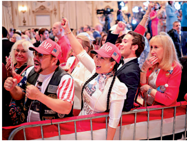
▲特朗普支持者5日在海湖莊園等待初選計票結果。

美國「超級星期二」兩黨總統初選5日投票結束，美國總統拜登和前總統特朗普分別橫掃多州大勝，各自擴大黨內領先優勢，11月再度上演「特拜對決」幾乎成為定局。兩人已視對方為大選對手，當天加大力火互相攻擊，抨擊對方「撕裂美國」。但很多美國選民對兩人均不滿意，有選民直言，無論是拜登還是特朗普，都不能代表自己。