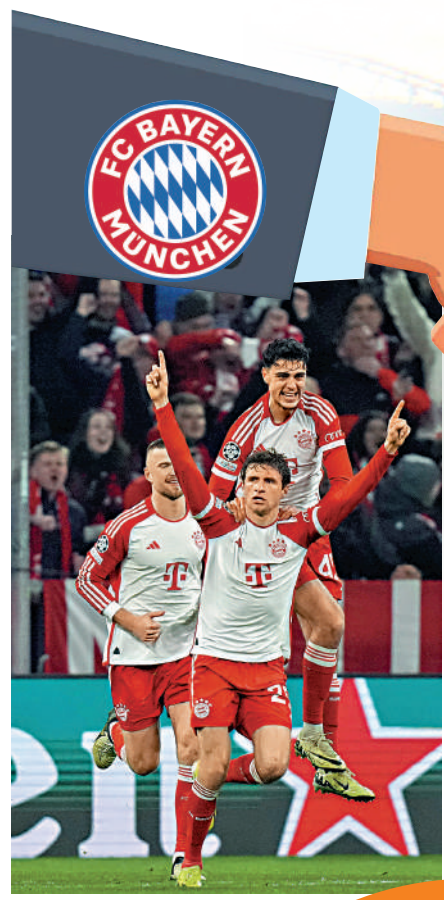
▲近日傳出沙比阿朗素傾向下季接掌拜仁，該隊即於昨晨歐聯16強次回合反勝拉素，晉級8強。