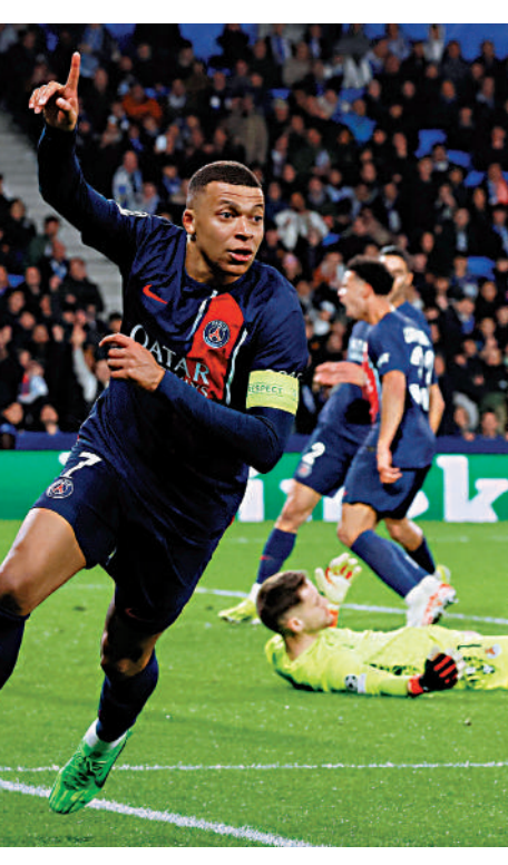
▲麥巴比(左)16強兩回合合計，共取得三路透社

【大公報訊】據ESPN FC報道：連續3場法甲只任後備或提前被換下之後，基利安麥巴比於昨晨歐聯16強次回合合作皇家蘇達之役再次以正選踢足全場，結果亦不負所望射入兩個顯示功架的入球，協助巴黎聖日耳門今仗再贏2:1，總成績以4:1輕取皇蘇，闖入8強。