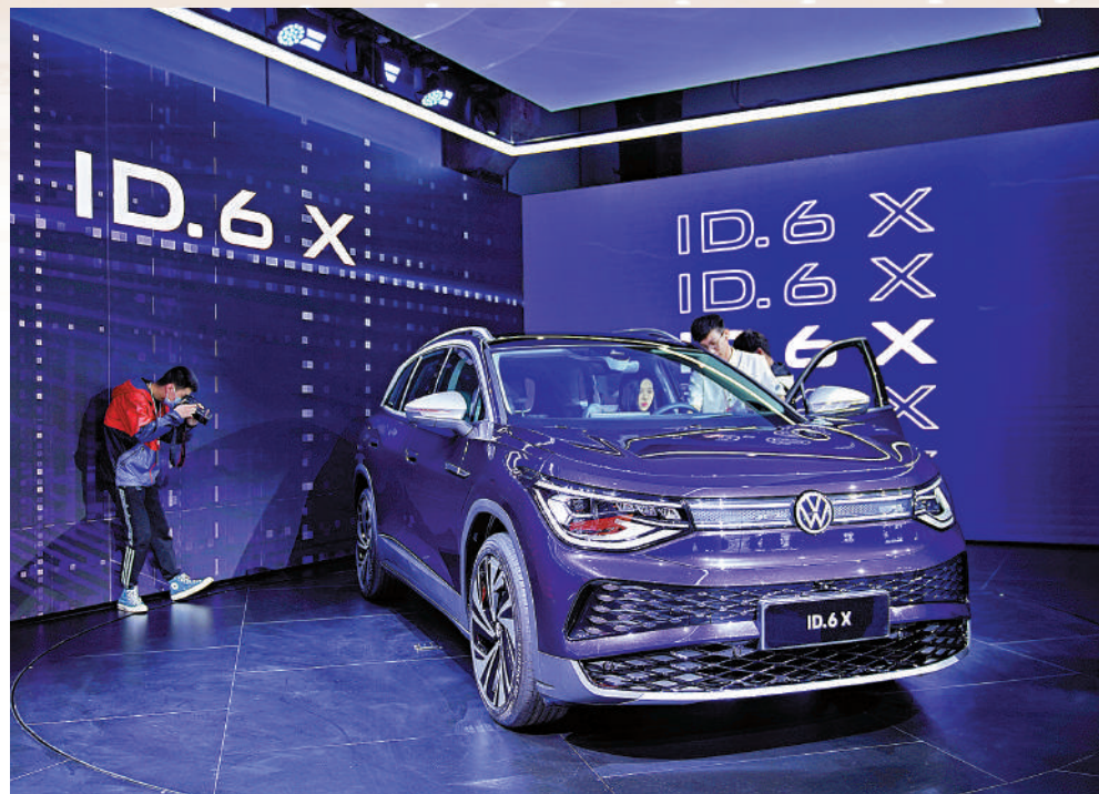
▲今年更多外商追加對華投資，例如投資約10億元的大眾汽車海外最大研發中心年初在中國投入運營。圖為在上海車展亮相的大眾新能汽車。