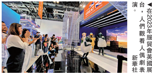
▲在2023年服貿會英國展台上，人們觀看人偶劇表演。

中國美國商會主席譚森指出，2023年在華美企的財務表現有所改善，盈利水平、息稅前利潤率均有所上升。對眾多企業而言，中國不僅是關鍵市場，更是人才和創新的重要沃土。