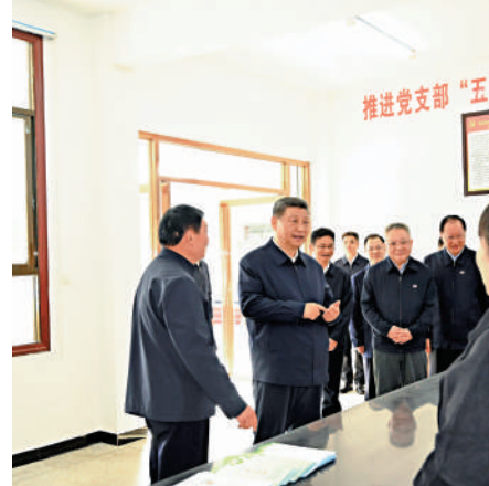
▲3月19日，習近平在湖南省常德市鼎城區謝家鋪鎮中坪村考察，了解提升基層治理效能等情況。 新華社

丁薛祥在講話中表示，要深入學習貫徹黨的二十大精神和習近平總書記重要講話精神，緊扣高質量發展要求，推動中部地區崛起不斷取得新成效。加強科技創新和產業創新深度融合，因地制宜加快發展新質生產力。大力提升糧食、能源資源安全保障能力，實現高質量發展和高水平安全良性互動。深化全國統一大市場建設和高水平開放合作，不斷增強發展內生動力和活力。持之以恆抓好生態環境保護，厚植高質量發展的綠色底色。