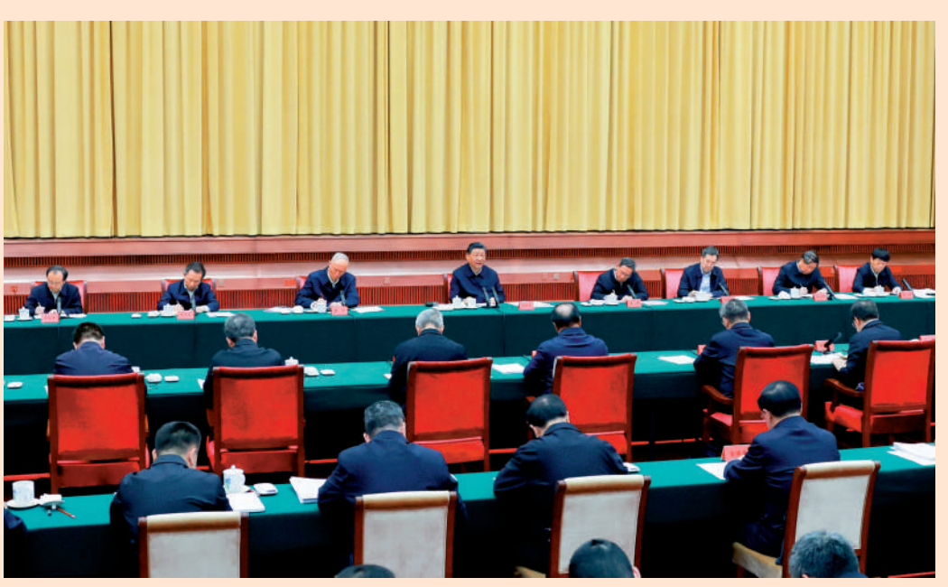
▲3月20日，習近平主持召開新時代推動中部地區崛起座談會並發表重要講話。

中共中央總書記、國家主席、中央軍委主席習近平3月20日下午在湖南省長沙市主持召開新時代推動中部地區崛起座談會並發表重要講話，強調在更高起點上扎實推動中部地區崛起。他強調，中部地區是我國重要糧食生產基地、能源原材料基地、現代裝備製造及高技術產業基地和綜合交通運輸樞紐，在全國具有舉足輕重的地位。要一以貫之抓好黨中央推動中部地區崛起一系列政策舉措的貫徹落實，形成推動高質量發展的合力，在中國式現代化建設中奮力譜寫中部地區崛起新篇章。習近平指出，要加強與京津冀、長三角、粵港澳大灣區深度對接，加強與長江經濟帶發展、黃河流域生態保護和高質量發展的融合聯動。