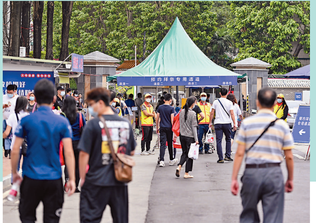
▲港人北上祭拜掃墓需提前預約。圖為廣州市民按預約時段分批進入陵園。