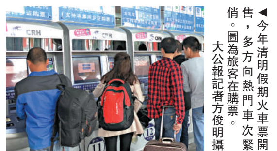
▲今年清明假期火車票開售，多方向熱門車次緊俏。圖為旅客在購票。大公報記者方俊明攝