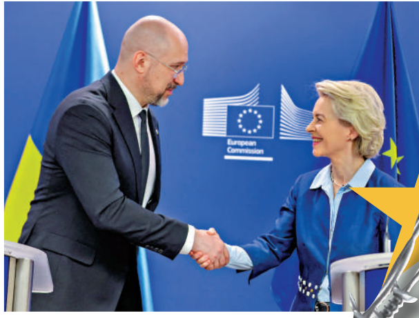
▲烏克蘭總理什梅加爾(左)和歐盟委員會主席馮德萊恩20日在布魯塞爾會面。