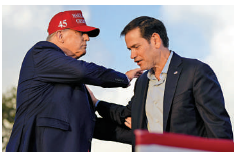
▲2022年11月，特朗普(左)和盧比奧在邁阿密出席造勢活動。

康奈爾大學電影和媒體研究教授謝潑德稱，諾姆「美國小姐般的白人女性氣質」，可能被特朗普視為他「最完美的裝飾品」。