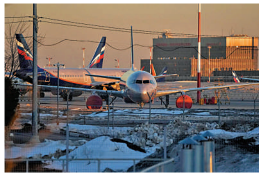
▲一架俄羅斯航空公司的飛機停在莫斯科郊外一個機場。

【大公報訊】據《華爾街日報》報導：俄烏戰事爆發後，超過400架租賃給俄羅斯和外國航空公司的商用飛機被扣押在俄境內，價值超過100億美元。在俄羅斯航空業遭受西方制裁之際，航空公司收回這些飛機的希望十分渺茫。航空公司提出索賠後，保險公司指出，這些公司本應提前採取更多措施，以免飛機被扣押。保險業者認為，美國對烏克蘭的支持意味着美方實際上在與俄羅斯交戰，這將使索賠失效。