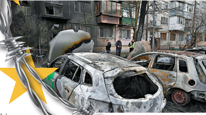
▲基輔多處居民樓和汽車被炸毀。