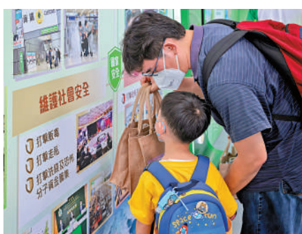
思法、青見表示，香港特區在完善的維護國家安全法律體系保障下，將有了更安全的環境，可集中力量拚經濟、謀發展、惠民生。

安全法規，香港不幸經歷了黑暴風波，外部勢力串聯本地反中亂港分子肆意發動反政府暴亂，挑戰法律及政權，對社會、經濟及民生產生極為惡劣的影響，不少市民亦深受其害。因此，《條例》的推出，正正回應了廣大市民對「國家好」的追求，以及對國家安全的重視。