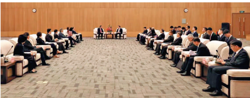
夏寶龍昨日下午，中央港澳工作辦公室主任、國務院港澳事務辦公室主任夏寶龍在深圳會見香港特別行政區立法會主席梁君彥一行，聽取有關工作情況匯報。有關單位負責人參加會見。