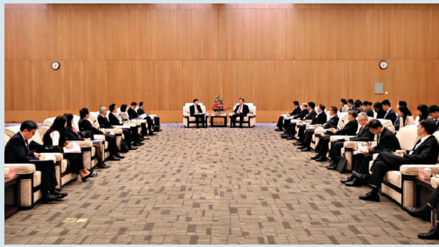
夏寶龍昨日上午在深圳會見行政長官李家超一行，聽取工作情況匯報。