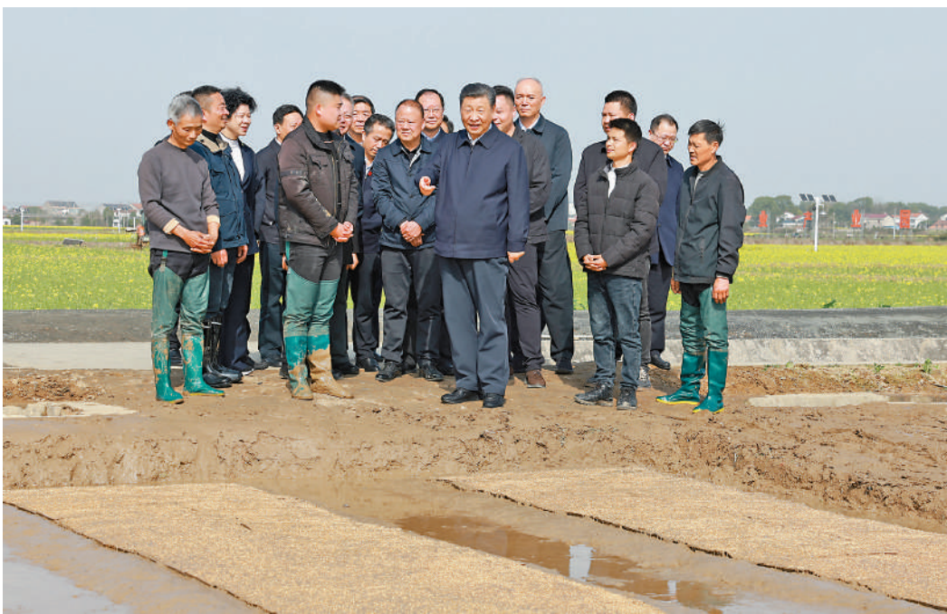
▲3月19日，習近平在常德市鼎城區謝家鋪鎮港中坪村考察，了解春耕備耕等情況。

21日上午，習近平聽取了湖南省委和政府工作匯報，對湖南各項工作取得的成績給予肯定。習近平指出，科技創新是發展新質生產力的核心要素。要在以科技創新引領產業創新方面下更大功夫，主動對接國家戰略科技力量，積極引進國內外一流研發機構，提高關鍵領域自主創新能力。強化企業科技創新主體地位，促進創新鏈產業鏈資金鏈人才鏈深度融合，推動科技成果加快轉化為現實生產力。聚焦優勢產業，強化產業基礎再造和重大技術裝備攻關，繼續做大做強先進製造業，推動產業高端