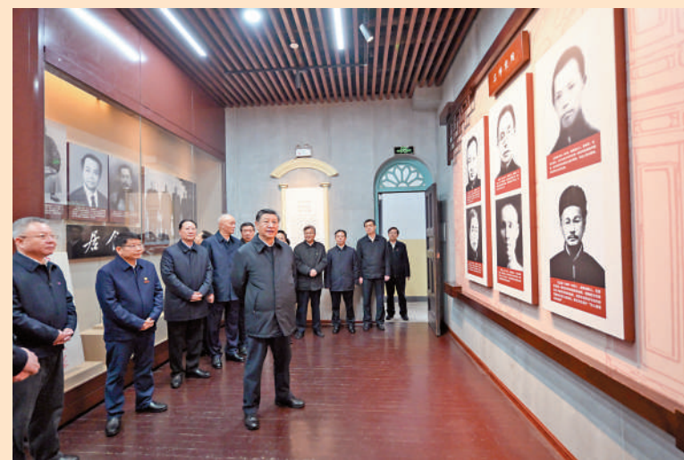
▲3月18日下午，習近平在長沙市考察調研。這是習近平在湖南第一師範學院（城南書院校區）考察，了解學校用好紅色資源、堅持立德樹人等情況。

中共中央總書記、國家主席、中央軍委主席習近平近日在湖南考察時強調，湖南要牢牢把握自身在構建新發展格局中的戰略定位，堅持穩中求進工作總基調，堅持高質量發展不動搖，堅持改革創新、求真務實，在打造國家重要先進製造業高地、具有核心競爭力的科技創新高地、內陸地區改革開放高地上持續用力，在推動中部地區崛起和長江經濟帶發展中奮勇爭先，奮力譜寫中國式現代化湖南篇章。他並強調，中國開放的大門會越開越大，我們願意同世界各國加強交流合作，歡迎更多外國企業來華投資發展。