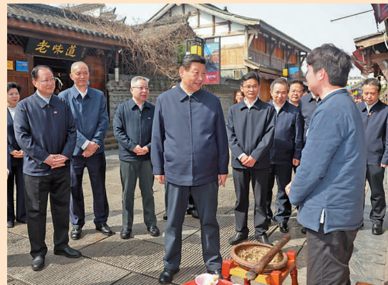
▲3月19日，習近平在常德河街考察，了解歷史文化街區修復利用、城市水環境綜合治理等情況。新華社