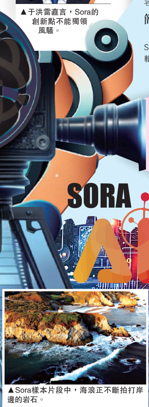
▲Sora樣本片段中，海浪正不斷拍打岸邊的岩石。