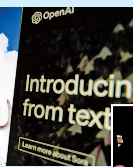
▶Sora是OpenAI開發的人工智能文生視頻大模型。