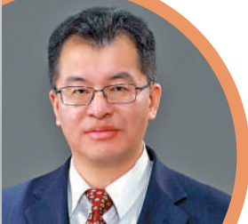
▲康復指出，現階段的Sora遠未到產品化的成熟期。