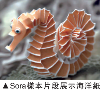
▲Sora樣本片段展示海洋紙藝世界。

不過，Sora的應用引發虛假信息的爭議，因為其強大的圖像視頻生成能力或會導致以假亂真，視頻證據存在真實性和有效性的驗證難題。此外，Sora生成的視頻版權是否受到保護尚不明確，這可能導致使用這些視頻的主體面臨侵權索賠和版權保護追溯的風險。另一方面，Sora所使用的素材，即使只是用於訓練，也有潛在侵權風險。