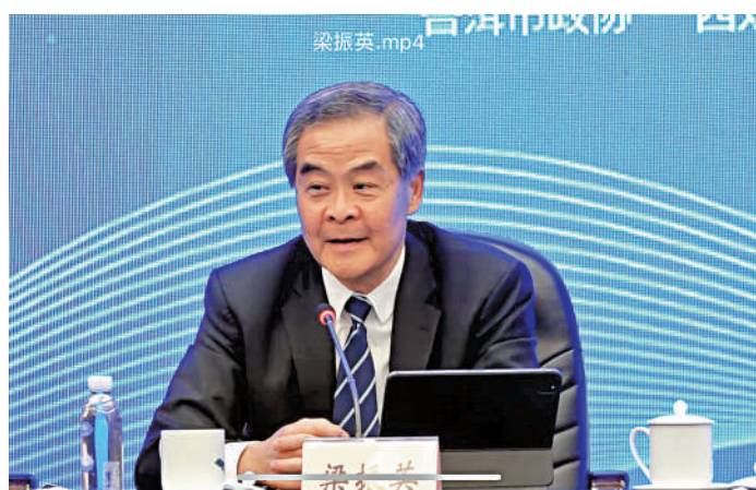
▲3月29日下午，「千名企業家雲南行(2024)」在昆明啟動，全國政協副主席梁振英出席開幕式並致辭。

【大公報訊】記者譚曼煦、任青昆明報道：3月29日下午，「千名企業家雲南行(2024)」在昆明啟動，全國政協副主席梁振英出席開幕式並致辭，他回憶40年前第一次來雲南和最近一次來雲南的經歷時說，這一次可以感受到雲南這些年發展迅速，結合香港與雲南的優勢和發展目標，他說，兩地要做好夥伴，以這次契機來說，要寫逗號，把交流合作長期繼續做下去。