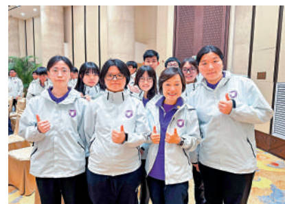
▲蔡若蓮期望參訪團團員，以親身經歷、親眼所見，多角度認識國家最新的發展成就。