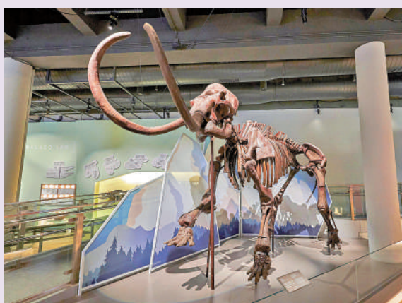
▲即將歸還予國家自然博物館、超過三米高的真猛犸象化石。