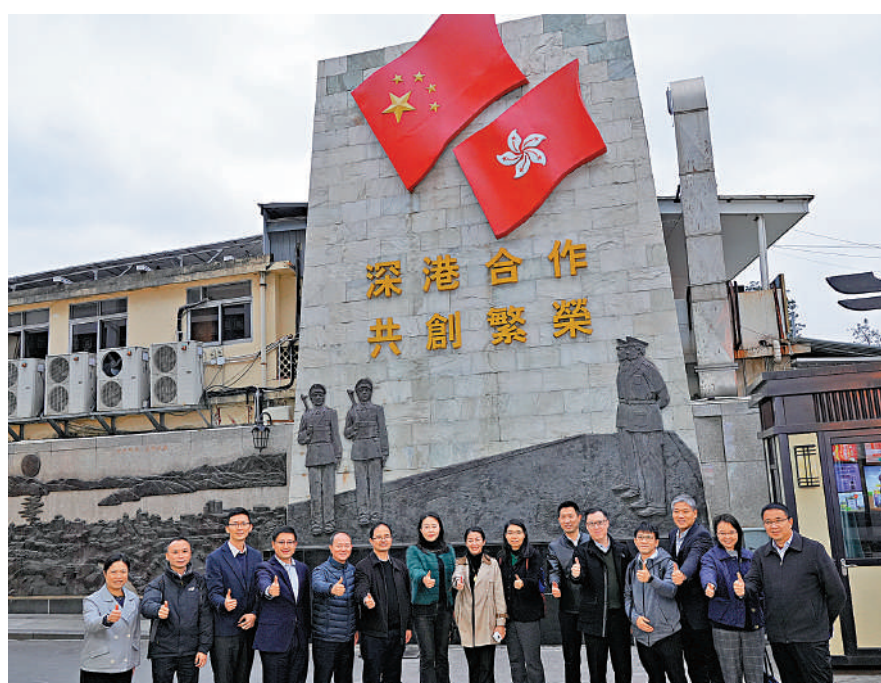
▲香港交流人員獲安排到中英街參觀。