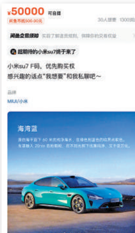
▲二手平台上F碼轉讓價普遍逾5000元,最高達5萬元。

有市場人士指出,小米汽車將面對不少強勁對手,特別是新能源車一哥比亞迪(01211),因後者技術實力雄厚,特別是刀片電池,質量及價格具競爭力,除自用外,亦出售給不少同業。眾所周知,新能源車的電池佔成本約三成左右,但過去很多車企都因電池價格高,令成本壓力沉重,小米如何克服這個難關,仍有待考驗。同時,當小米SU7交付後,將面對駕駛者和市場不同的批評和意見,如何贏得消費者信賴,則很考小米的功夫。