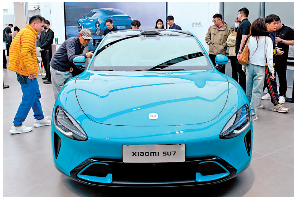
▲小米SU7公布定價後,「小米SU7價格」亦衝上微博热搜首位。

注度極高,主要因為小米集團與管理層過往在消費電子的成功經歷具備較強說服力,及同為2C產品,小米汽車同樣享受了小米帶來的無與倫比的流量。再者,就產品本身來說,小米SU7造型、配置以及宣傳端已具備一定優勢。就造車理念或商業模式來說,小米可能進一步將車帶入IoT生態,打造「人—車—家」,作為互聯網領域的佼佼者,真正開始將汽車商業模式往下一個十年推進,帶來全新看點。