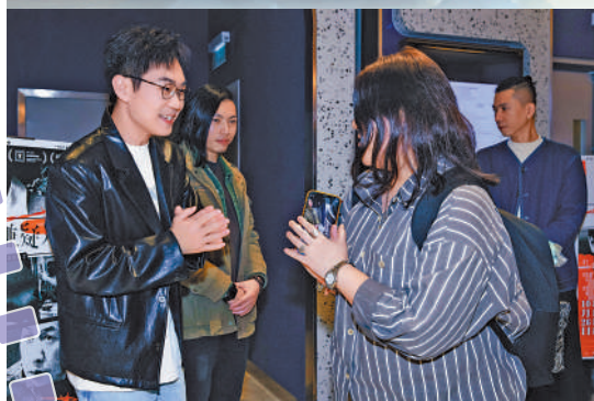
▲大鵬（左一）早前來港謝票，與觀眾互動。