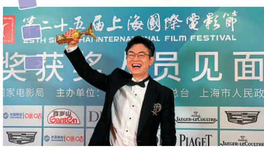
▲大鵬2023年獲上海國際電影節金爵獎「最佳男演員」。

打架打到斷手斷腳，我分辨不出是真還是假，留下非常深刻的印象。其實在整個成長時期，香港電影都影響着我，尤其黃百鳴的喜劇系列、周星馳的喜劇系列，都影響了我以後的戲劇表演。」