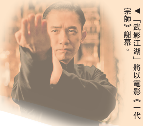
▲「武影江湖」將以電影《一代宗師》謝幕。

晚間節目「星空電影院」將於4月6日及7日分別放映本地經典電影《黃飛鴻之二男兒當自強》（1992）及《西遊記大結局之仙履奇緣》（1995），觀眾可坐在草地上享受戶外看電影的樂趣。