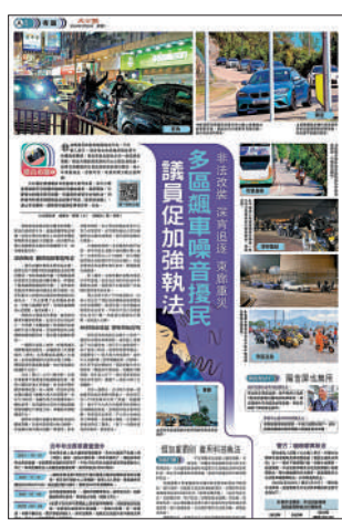
▲《大公報》日前報道多區飆車噪音擾民，促加強執法，引起關注。

香港的非法賽車和非法改裝車飆車產生的聲浪問題，一直困擾居民多年，數十年來屢禁不止。港島東區走廊鄰近的屋苑一直是重災