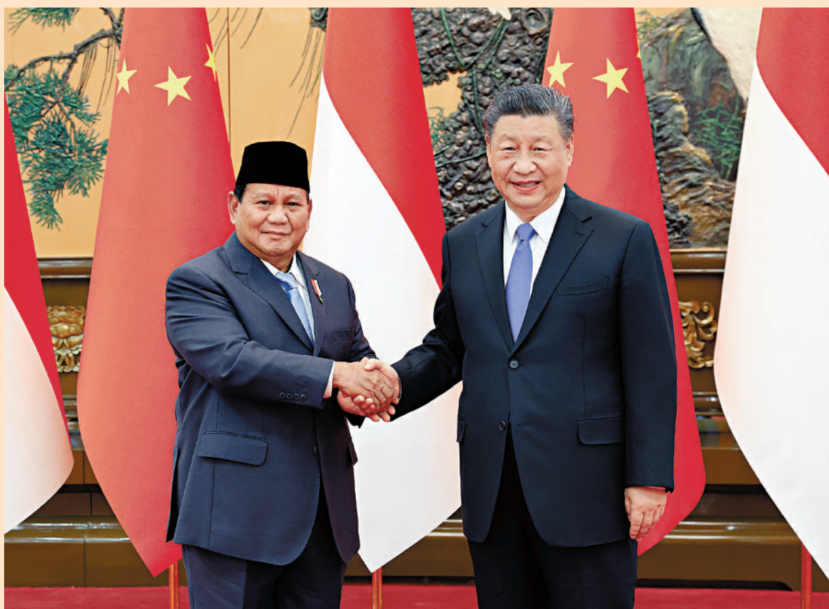
▲4月1日下午，國家主席習近平在北京人民大會堂同印尼當選總統普拉博沃舉行會談。