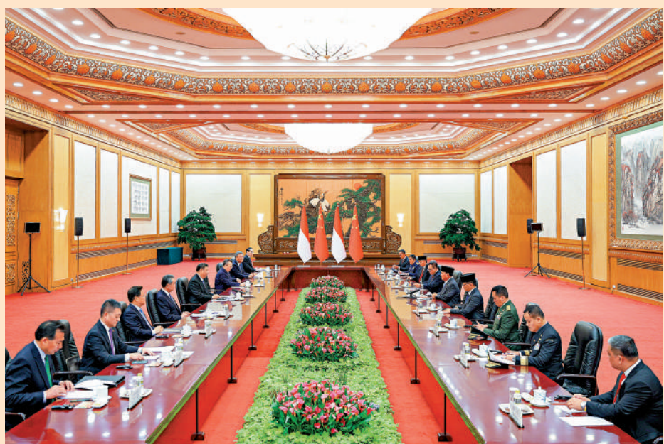
▲4月1日，國家主席習近平在北京人民大會堂同印尼當選總統普拉博沃舉行會談。圖為會談現場。