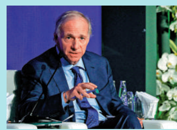
▲ 達里奧表示，不會放棄中國這個世界第二大經濟體市場。

達里奧的投資組合稱為全天候組合（The All-Weather portfolio），是由他自己所主理，意即在全球分散投資，以期在任何市況下都有理想表現。最新資料顯示，截至4月2日止，該組合今年的投資回報暫為1.27%，但過去10年間每年的回報率則達5.22%。