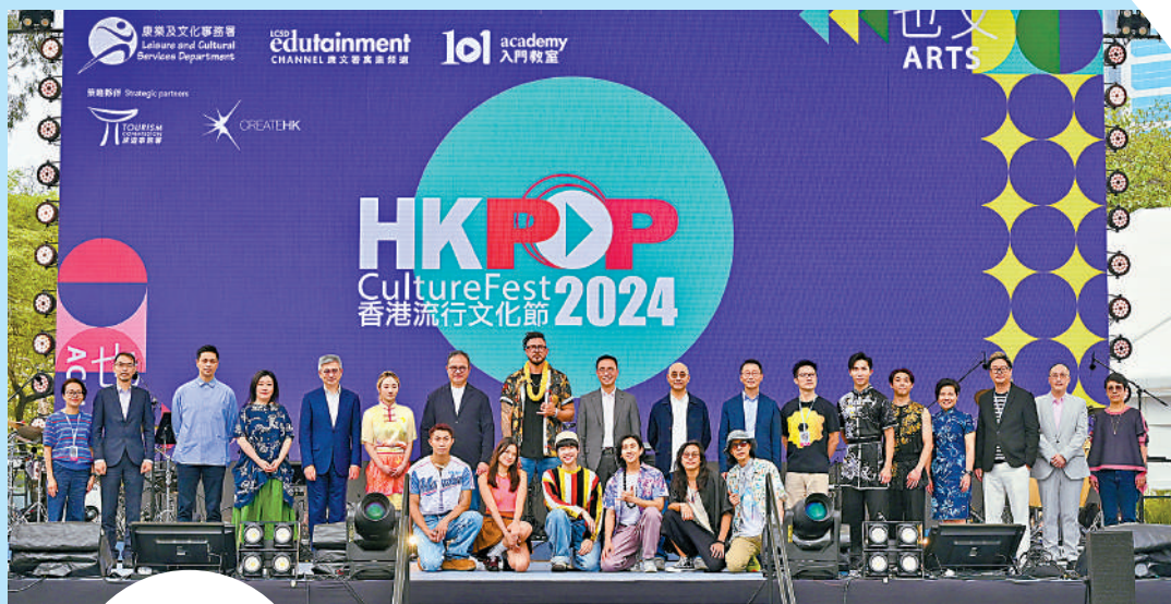
▲眾嘉賓昨日出席香港流行文化節2024節目巡禮。