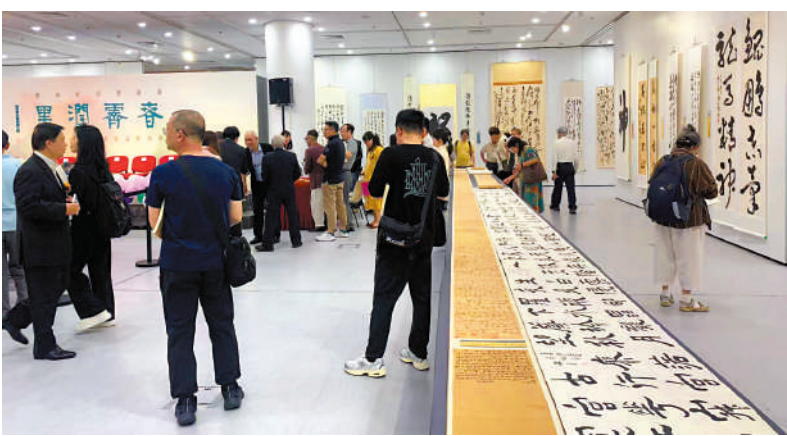
▲「春霽潤墨」書法展昨日開幕，吸引不少人士參觀。