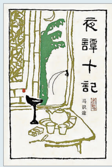
▲《夜譚十記》，馬識途著，人民文學出版社。