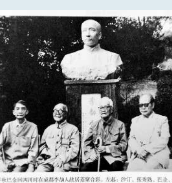
▲1987年，（左起）沙汀、張秀熟、巴金、馬識途在成都李劫人故居聚宴合影。

中國當代著名作家、詩人、書法家。自20世紀60年代正式開始文學創作，出版了小說、詩歌、散文20多部500餘萬字，代表作包括《清江壯歌》《夜譚十記》《巴蜀女傑》《魔窟十年》《滄桑十年》等。《夜譚十記》中的《盜官記》被改編為獲得多項大獎的電影《讓子彈飛》。