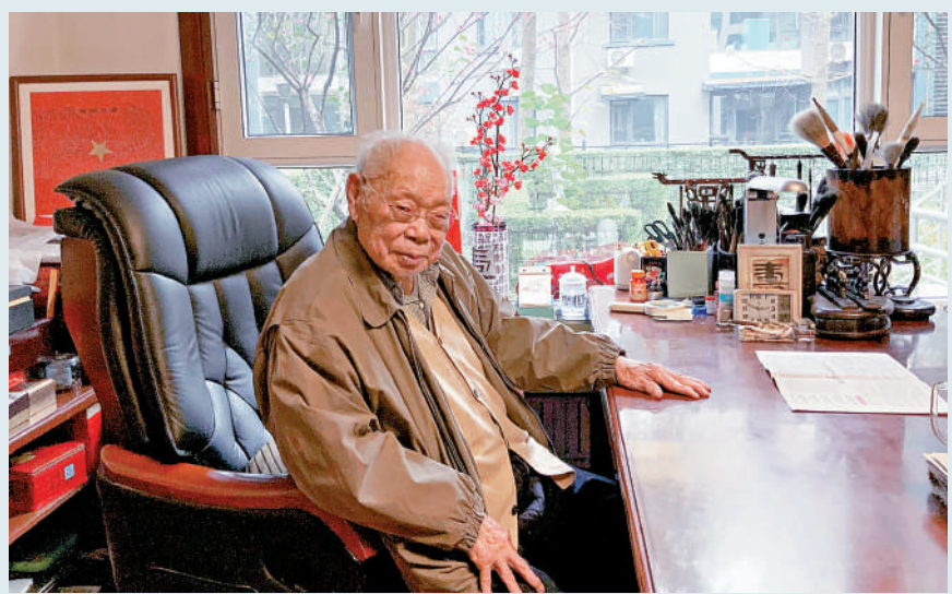
▲馬識途自20世紀60年代正式開始文學創作，出版了小說、詩歌、散文20多部共500餘萬字。

3月28日，著名作家馬識途與世長辭。王蒙曾說馬識途「是中國文化的吉兆，是人瑞，是中國的國寶，是四川的川寶，是作家協會的會寶。」誠哉斯言。先生享年110歲，橫跨晚清、民國、新中國三個歷史時期，以一生志業為後人留下了一部讀不完的大書。