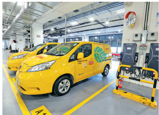
▲由於電動車的佔比將逐步提高，新運作中心設有多個電動車充電站。