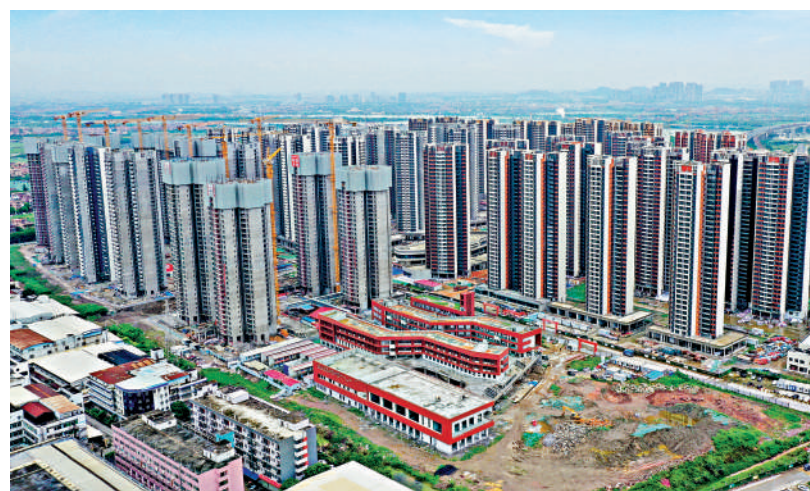
▲廣州住房公積金管理中心昨日公布，提高申請購房貸款的最高額度，當中一人申請上調至70萬元人民幣。

北京住房公積金管理中心對《關於住房公積金支持北京市建築綠色發展的實施辦法》公開徵求意見。其中提出購買二星級及以上綠色建築、裝配式建築或超低能耗建築，住房公積金最高貸款額度最多可增加40萬元，