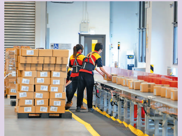
▲香港西運作中心的貨件處理能力提升至每小時5100件。

香港是國際貿易和物流中心，擁有優越的地理位置，5小時內可飛抵全球半數人口居住地。蔣國雄引述香港貿易發展局預測，今年香港貨運出口預計將增長4%至6%，加上跨境電商迎結構性增長機遇，以及配合粵港澳大灣區增長潛力、三跑道系統完成和港珠澳大橋等基建發展，對公司在港業務發展樂觀。