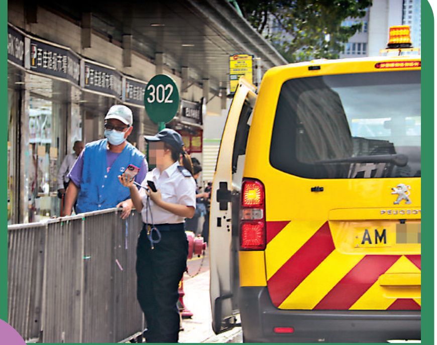
▲食環署職員疑為存檔，用手機拍下收取雜物的「赤膊大叔」。