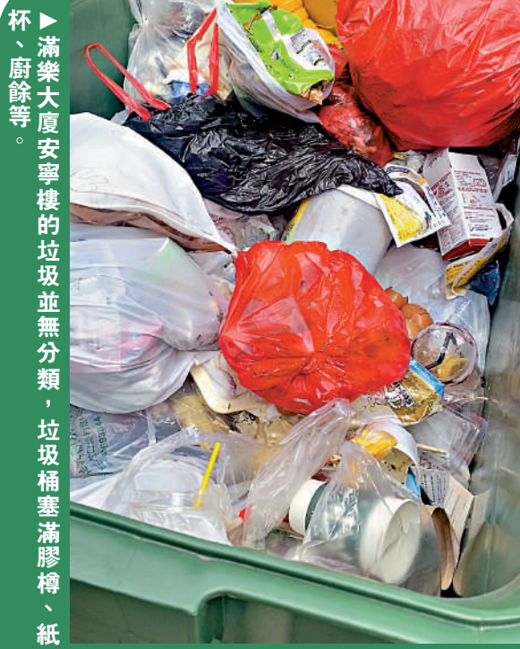
▶滿樂大廈安寧樓的垃圾並無分類，垃圾桶塞滿膠樽、紙杯、廚餘等。