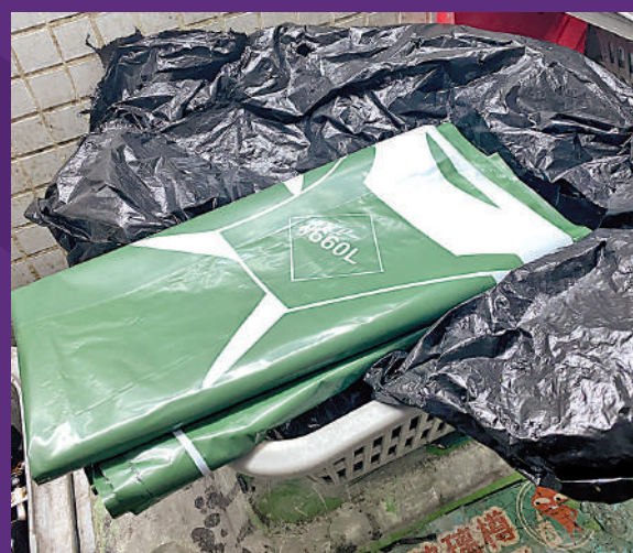
▶在新達廣場垃圾房，指定垃圾袋被亂棄一旁。