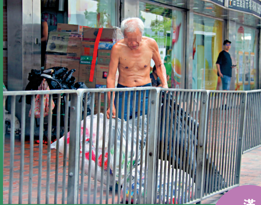
▲「赤膊大叔」由滿樂大廈收取多袋膠樽汽水罐等雜物。