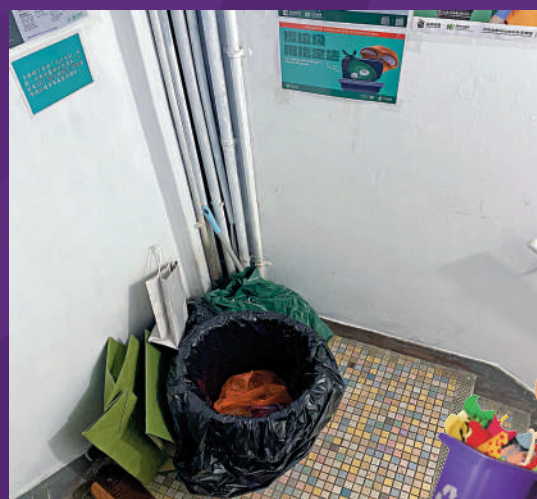
▶在長沙灣道58號的三無大廈，樓梯垃圾桶旁邊放有一疊指定垃圾袋。