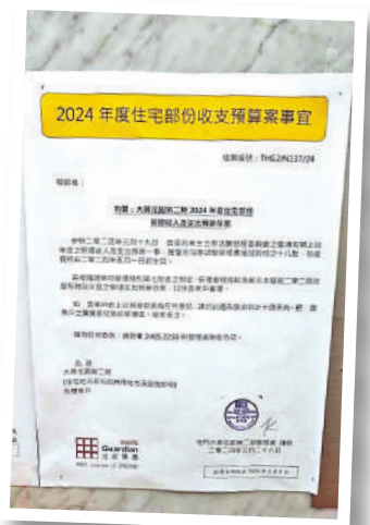
▲屯門大興花園第二期因應垃圾收費等原因，將於5月1日增加管理費18%。