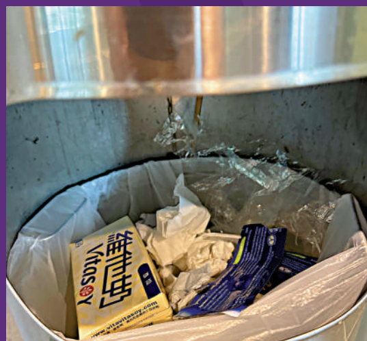
▶銀色垃圾桶仍用白色垃圾袋載垃圾，並無分類。