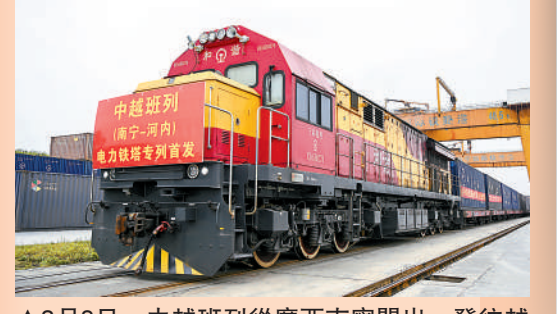
▲3月8日，中越班列從廣西南寧開出，發往越南河內。

2004年5月20日，越南領導人來華訪問時提出中越合作建設「兩廊一圈」的建議。同年10月8日，兩國政府發表聯合公報明確提出，雙方同意成立專家組，積極探討建設「兩廊一圈」問題。「一帶一路」和「兩廊一圈」對接，有助於越南發展基礎設施建設，中國在基礎設施建設上的資源、設備、資金和運營經驗將助力越南的經濟發展。同時，「一帶一路」和「兩廊一圈」對接也將促進中越兩國各領域合作，推動互聯互通，加強貿易往來，進一步釋放中越產能合作的巨大潛力。新華絲路