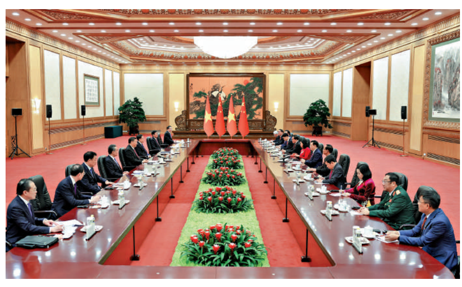
▲4月8日，中國國家主席習近平在北京人民大會堂會見越南國會主席王庭惠。

4月8日，國家主席習近平在北京人民大會堂會見越南國會主席王庭惠。習近平請王庭惠轉達對阮富仲總書記的親切問候。習近平指出，去年底我訪問越南期間，和阮富仲總書記共同宣布構建具有戰略意義的中越命運共同體，開啟了中越關係新篇章。在雙方共同努力下，我同阮富仲總書記達成的共識正在得到落實。志同道合、命運與共是中越關係最鮮明的特徵，「同志加兄弟」是中越兩黨兩國傳統友誼最生動的寫照。雙方要共同努力，推動中越命運共同體建設取得更多成果，服務各自現代化建設，更好造福兩國人民，也為世界社會主義事業作出更大貢獻。習近平強調，雙方要以高水平互信鑄牢中越命運共同體意識。