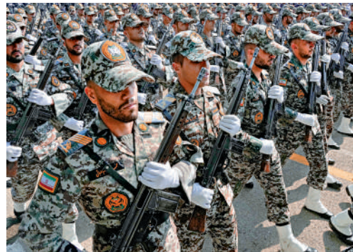
▲伊朗17日舉行建軍節閱兵式，向以色列及西方國家展示肌肉。

【大公報訊】綜合法新社、BBC報道：以色列16日稱，已就如何回應「伊朗及其代理人」13日對以色列發動的襲擊作出決定，但行動時機尚未選定，具體方案也可能改變。美國和歐盟正考慮對伊朗實施新制裁。土耳其總統埃爾多安批評西方國家雙標，對