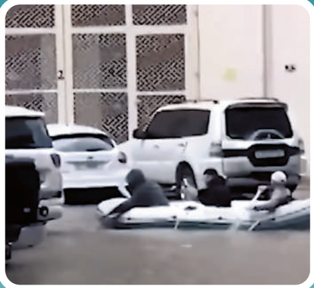
▼很多車輛17日被困在積水的道路上。