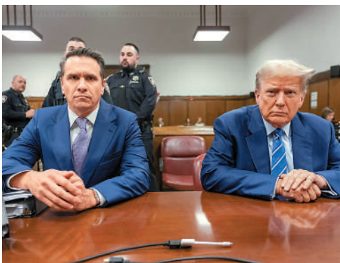
▲特朗普（右）16日再次就「封口費」案出庭。

此案共需選出12名陪審員及6名候補人員，由陪審員一致裁定特朗普是否有罪。陪審員遴選程序於15日啟動，但首日無人入選，直至16日才選出7名陪審員。在遴選過程中，陪審員個人信息不會公開，彼此之間僅通過由字母和數字組成的代號來認識。目前確定的陪審員為4男3女，年齡從