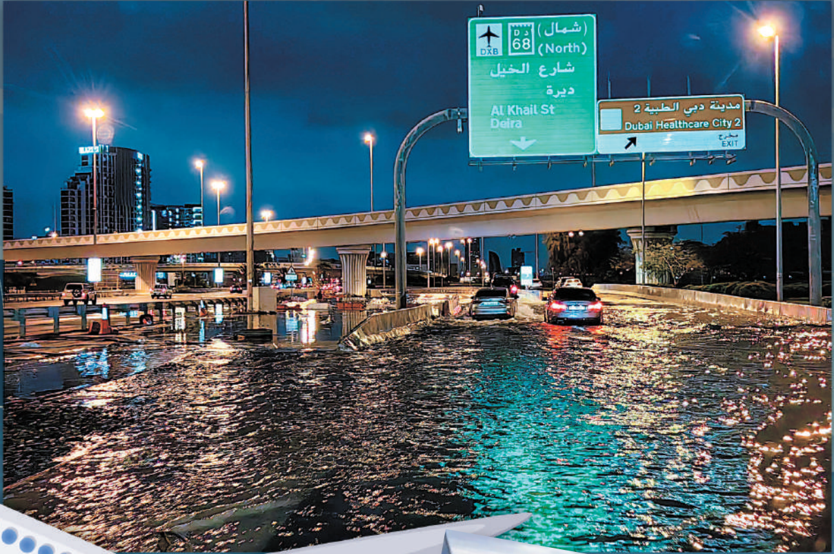
▲迪拜暴雨成災，通往機場的道路17日被水淹沒。