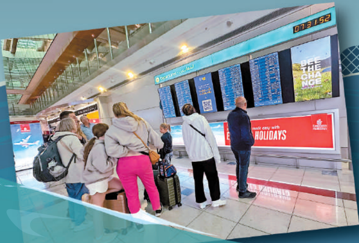
▲迪拜國際機場因暴雨陷入混亂，旅客17日查看航班延誤和取消情況。

沙漠國家阿聯酋16日遭遇罕見暴雨，多處水浸，至少一人死亡。最大城市迪拜一天的降雨量相當於以往兩年降雨量，迪拜國際機場一度陷入癱瘓，停機坪被淹沒，飛機如同輪船一般「破浪而行」。阿曼、巴林、卡塔爾和沙特等海灣國家亦出現強降雨，阿曼全國至少19人死亡。彭博社稱，阿聯酋暴雨成災與該國進行人工降雨有關，但阿聯酋當局否認此說法。CNN稱，氣候變化導致這種罕見暴雨越來越頻繁。