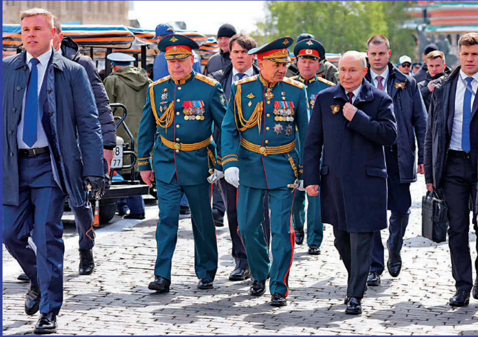
▲紹伊古（前排左三）9日陪同普京出席勝利日閱兵式。