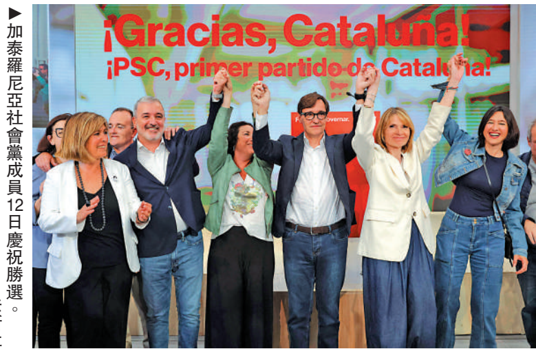
▲加泰羅尼亞社會黨成員12日慶祝勝選。

政治學家羅登說，分離主義政黨失去多數議席表明加泰羅尼亞局勢有變，但這種改變是暫時的還是長期的，仍需進一步觀察。