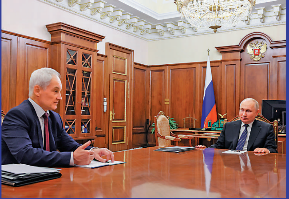
▲別洛烏索夫（左）將出任俄羅斯防長。