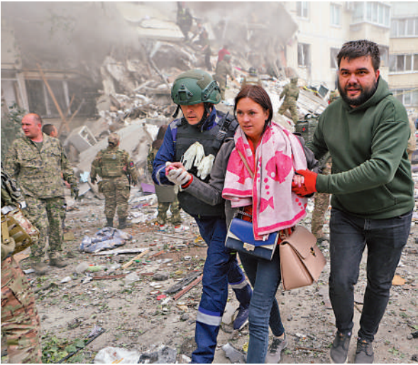
▲俄邊境地區別爾哥羅德12日遭烏軍空襲。