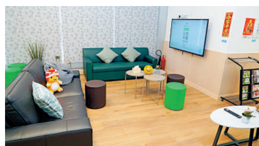
社區客廳設施齊全，為劏房戶提供額外生活空間。

入精準扶貧目標，有議員質疑政府取消貧窮線難以監察本港貧窮情況和政策成效，也有議員關注社區客廳等精準扶貧政策能否長遠維持，指社區客廳項目借用商界提供的地點，計劃期限只有三年，孫玉菫表示還未商討三年後如何，並以戀愛作比喻：「如果大家覺得『行得埋』、很好的，多相處一段時間是否可以，我覺得可以商量。」