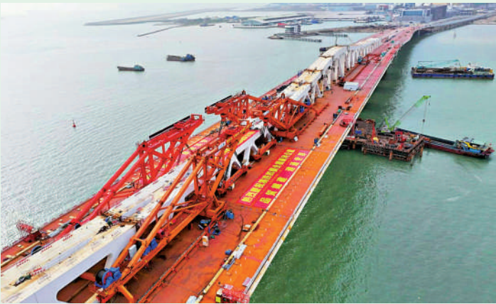
澳門大橋在今年3月12日順利實現全橋合龍。

澳門特區政府公共建設局3月26日表示，經參考澳氹第四條跨海大橋徵名活動評選委員會選出的五個名稱，澳門特區政府決定將澳氹第四條跨海大橋正式命名為「澳門大橋」。