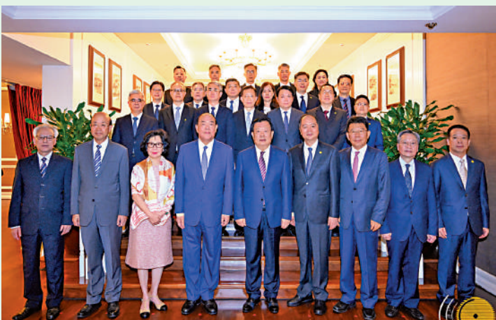
夏寶龍主任與澳門行政長官賀一誠及行政、立法、司法機構主要負責人交流。

出席交流活動的澳門特區行政、立法、司法機構主要負責人包括立法會主席高開賢、終審法院院長岑浩輝、行政法務司司長張永春、經濟財政司司長李偉農、保安司司長黃少澤、社會文化司司長歐陽瑜、運輸工務司司長羅立文、檢察院檢察長葉迅生、廉政專員陳子勁、審計長何永安、警察總局局長梁文昌、澳門特區海關關長黃文忠，以及行政長官辦公室主任許麗芳。