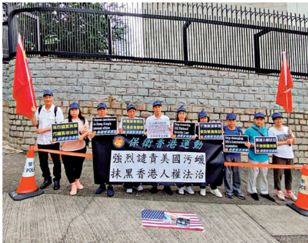
▲保衛香港運動到美國駐港總領事館抗議，要求美方立即停止損害香港國際聲譽的行為。

【大公報訊】記者龔學鳴報道：近期美國發布年度報告，針對香港特區各方面情況的存在失實言論和污衊抹黑，早前特區政府發表聲明，表示強烈不滿和反對。有團體昨日到美國駐港總領事館，抗議美國詆毀中國及香港的人權法治狀況。 保衛香港運動多名人員在領事館外拉起橫額喊口號請願，譴責美國國會及行政當局中國委員會發表的年度報告，詆毀中國及香港人權法治狀況，妄圖干預香港特區政府依法施政、破壞香港繁榮穩定，違反國際法和國際關係基本準則，充滿了虛偽雙標；又批評美國制裁維護國家安全的政府官員、法官等。他們要求美方立即停止損害香港國際聲譽的行為，促請美國停止干預香港事務。