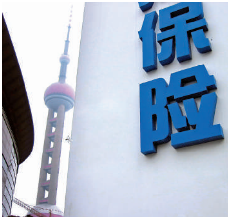
▲中國新增保費在2025年至2034年間將達到2560億美元，市場潛力巨大。

另外，瑞再研究所亞太地區首席經濟學家朱日平表示，目前內地壽險存在負利差問題，投資收益率高於高息期間的保證回報，對於保險企業而言，這是巨大而持續的挑戰。他建議內險企可以借鑒日本的經驗，加入更多外國證券及加強風險管理。