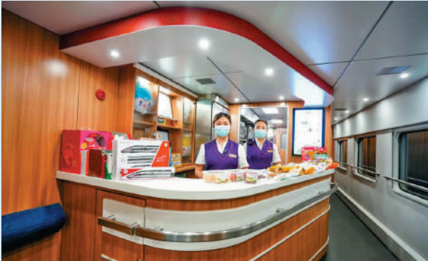
►動卧列車設有餐吧，備餐食飲品，供旅客選購。