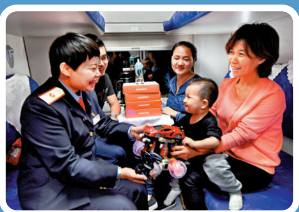
▲在夜班動卧列車上，乘務員為小旅客提供愛心服務。