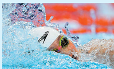
▲李冰潔在初賽嶄露實力，是國家隊在200米自由泳的爭牌奇兵。