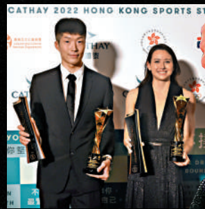
▲張家朗（左）曾5奪香港傑出運動員，當中3次成爲星中之星。