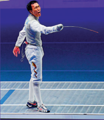
▲莫梓維是國家隊在男子花劍的獎牌希望。