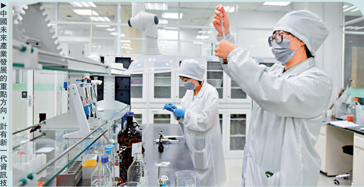
中國未來產業發展的重點方向，計有新一代資訊技術、人工智能、航空航天、新能源、新材料、高端裝備、生物醫藥、量子科技等戰略性產業。

總括而言，若曾經破產人士打算置業及申請按揭，事前應多了解、多查詢，以免在申請按揭時「觸礁」。筆者建議透過按揭中介專業諮詢，配對至合適的銀行或財務機構。