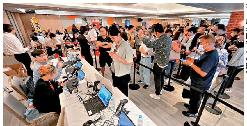
破產人士坐完「破產監」後重新出發，處理時需小心謹慎，只是手續較繁。

筆者謹向數字辦的成立表示熱烈祝賀，並衷心祝願在未來的工作中取得卓越成績，為香港的數字化轉型作出更大貢獻。