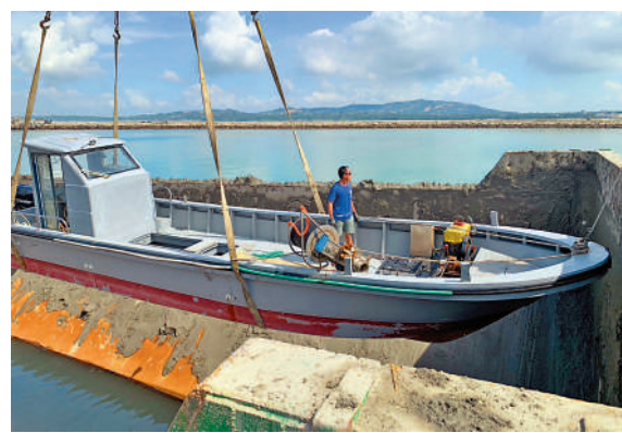
▲在「2·14」撞船事件中被台方撞翻的大陸漁船30日從金門運回大陸。

示：「對於家屬所受的煎熬，願意再次公開表達歉意，請家屬節哀。」隨後，台海巡部門、晉江紅十字會、台陸委會、海基會、金門縣政府的代表依次上香、獻花、獻果、行三鞠躬祭奠禮，向家屬致以慰問。