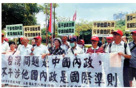
▲台灣民間團體30日抗議賴當局勾連外部勢力破壞兩岸和平。

【大公報訊】綜合新華社、中新社報道，兩岸和平發展論壇、反「台獨」反介入聯合行動等台灣民間團體30日在