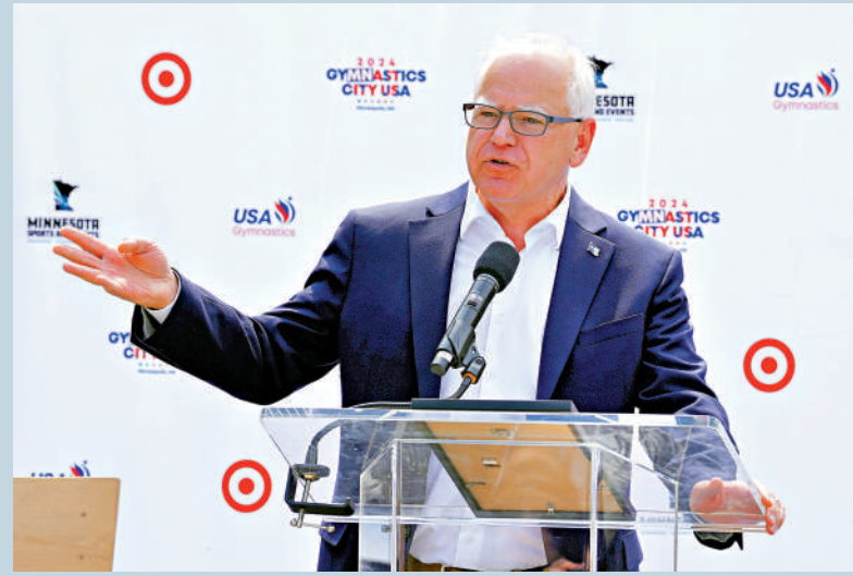
▲明尼蘇達州州長沃爾茲成為哈里斯的競選搭檔。