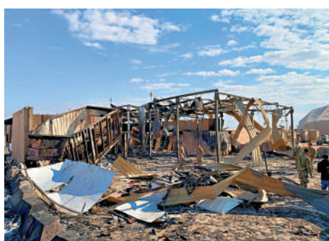
▲伊拉克美軍阿薩德空軍基地多次遇襲。圖為該基地2020年1月遭伊朗導彈襲擊後損壞情況。

炸，並冒出濃煙。兩名伊拉克安全消息人士稱，兩枚「喀秋莎」火箭彈落在基地內。五角大樓預計，未來幾天，親伊朗武裝力量將對該地區的美軍發動更多襲擊。伊拉克駐有約2500名美軍，同時與伊朗支持的民兵組織有密切聯繫。