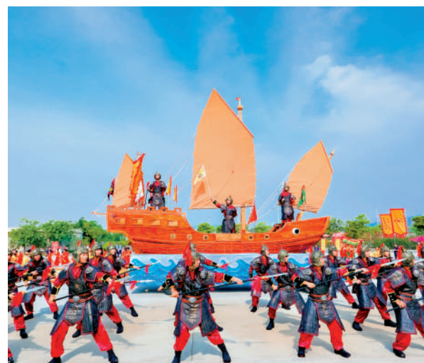
▲鄭成功文化節主題民俗表演。

鄭成功文化節還將陸續舉行成功市集、高甲戲人物攝影、台灣大學生主題夏令營、台灣青年「成功故里精英行」等一系列活動。其中9日晚間，鄭成功故里南安正式發布「成功家宴」，數百位海峽兩岸的嘉賓共享盛宴。