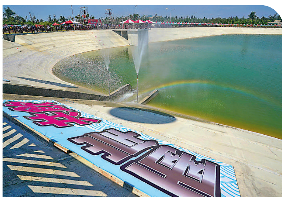
▲福建向金門供水工程開通6年來，累計供水超過3500萬噸。圖為2018年8月5日，金門鄉親在田埔水庫見證「兩岸通水」歷史時刻。

為推動兩地融合發展，近年來，大陸方面出台了一系列政策措施，擘畫了「廈門金門對門，鷺島浩島橋連橋」的美好願景。其中，廈金大橋的廈門境內段已於2023年10月開工，預計2026