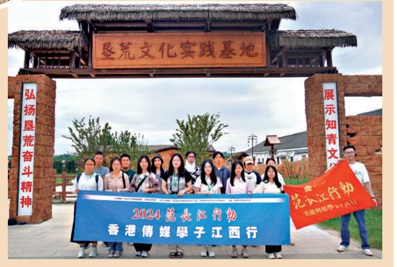
▲「2024范長江行動——香港傳媒學子江西行」採訪團部分成員在共青城墾荒文化體驗園合影。