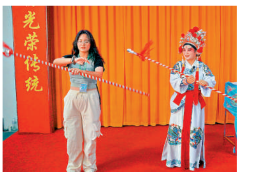
▲採訪團成員跟隨國家級非物質文化遺產西河戲傳人學習耍花槍。

新天地。此外，共青城也與香港有個淵源：當地於1969年將約9萬隻板鴨出口到香港，掙回9萬元人民幣，協助共青墾殖場渡過困難時期。