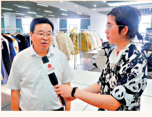
▲採訪團專訪共青城市委書記盧治軒。

共青城市委書記盧治軒在接受「2024范長江行動江西行」採訪團專訪時表示，非常歡迎香港傳媒學生朋友們到共青城來做客。希望香港青年多到共青城走一走、看一看，希望大家走進、愛上、加盟這座美麗的城市。「青春孕育無限希望，青年創造美好明天，希望我們廣大的青年朋友，特別是香港的青年朋友，都到我們這裏來創業，和我們共同一起創造更加美好的明天。」盧治軒表示，我們將會為來共青城創業的香港青年提供全方位的保障、五星級的服務，讓大家這裏能夠安心地學習、愉快地生活、高興地就業。