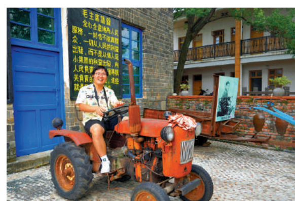
▲採訪團成員坐拖拉機，體驗老一代人的青春歲月。

據統計，1955—1956年，上海青年志願墾荒隊共計1700多人來到江西墾荒。經過一年奮鬥，墾荒隊共開墾1700畝荒地，加上當地送的8000多畝荒