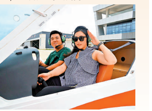
▲採訪團成員登上小型飛機，演繹港劇《衝上雲霄》。