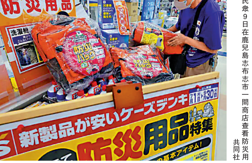
▲日本民眾9日在鹿兒島志布志市一間商店查看防災用品。