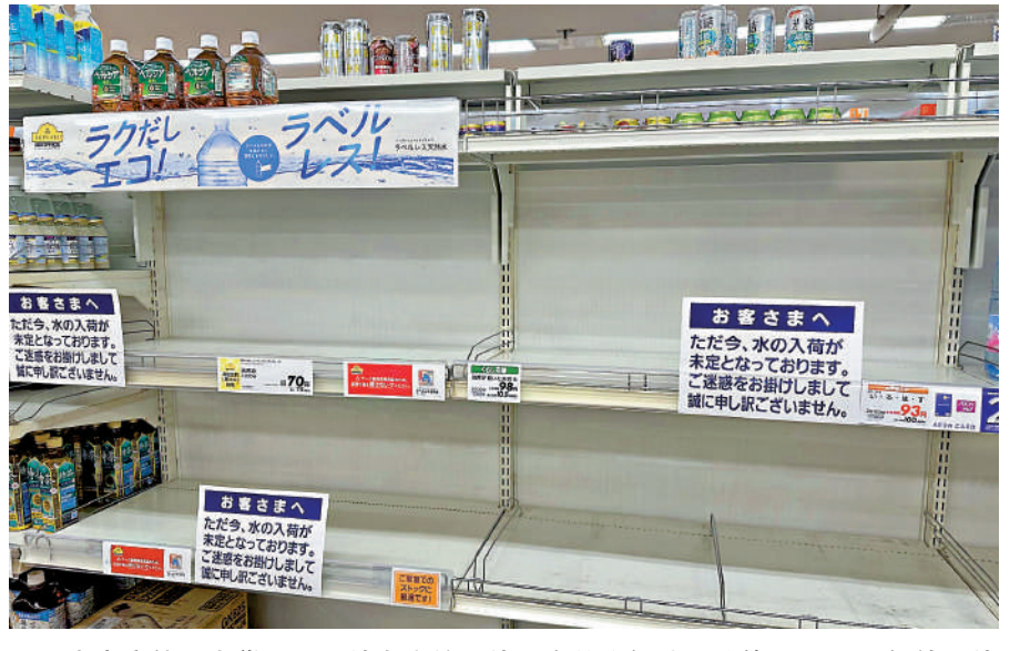
▲日本商店飲用水貨架近乎被搬空的照片，在社交網站上流傳。