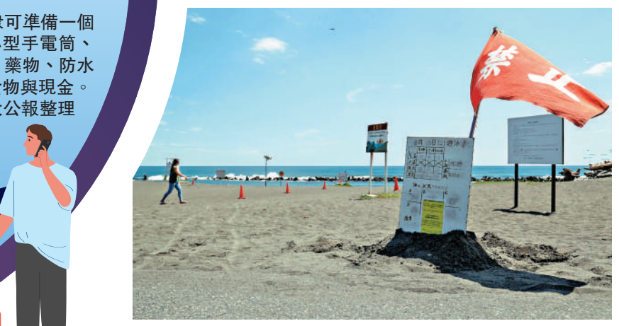
▲日本神奈川縣海濱公園警告人們不要游泳。

【大公報訊】據BBC、中央社報道：日本處於地震多發區，一年發生約1500次地震。儘管絕大多數地震造成的破壞很小，許多日本民眾仍從小就被警告，會有百年一遇的大地震，最壞情況可造成30多萬人死亡，30米高的海嘯可能淹沒整個國家。日本氣象廳8日首次發布「南海海槽地震」警報後，由於未要求民眾避難，讓人感到困惑。地震發生是「群集現象」，但無法事先判斷某一場地震，屬於前震還是餘震。為了防止「311」重演，日本政府在2017年推出新的預警系統，但直到上周，才首次使用該系統，發出了南海海槽地震預警。當局雖提醒民眾做好準備，卻沒有要求撤離。有日本民眾向BBC表示，「我對警報感到疑惑，不知道該怎麼理解。我們知道無法預測地震，而且我們一直被告知大地震總有一天會發生，所以我一直問自己：這是地震嗎？但我覺得並不真實。」