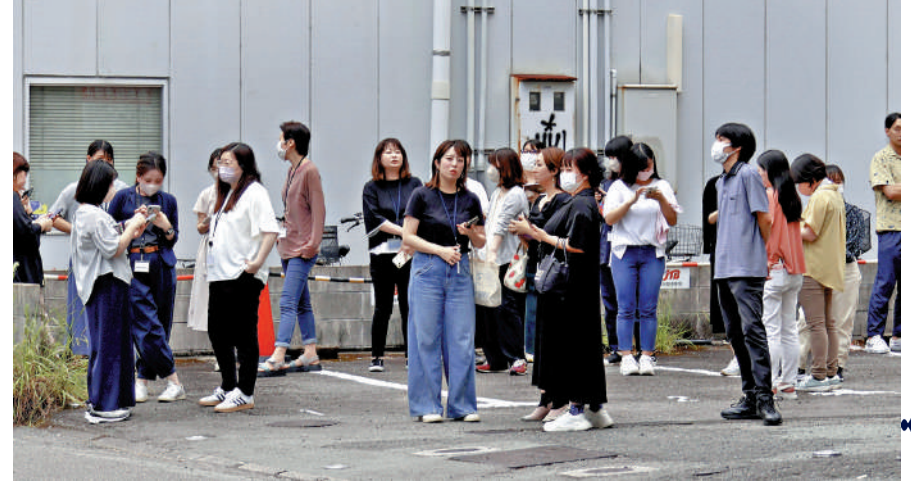
▲日本宮崎縣8日發生地震後，民眾在戶外避難。

日本宮崎縣外海8日下午發生7.1級地震，日本氣象廳當天首次罕見發出「南海海槽巨大地震」預警，敦促民眾在未來一周內保持高度警惕，以防出現強烈地震以及海嘯。日本民眾搶購飲用水和罐頭等應急食物。香港特區政府12日提醒身在日本或計劃前赴日本的香港居民，要提高警惕。