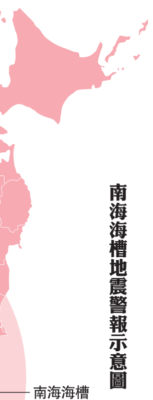
南海海槽地震警報示意圖