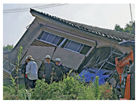
▲日本鹿兒島一所房屋8日在地震後倒塌。