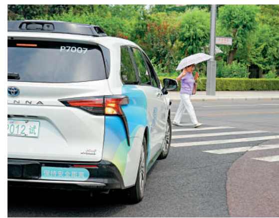
▲在北京亦莊，自動駕駛測試車輛在道路上測試自動避讓行人。

2021年1月底，中國智能手機製造商小米在美國哥倫比亞特區聯邦地區法院，對美國國防部和財政部提起法律訴訟，美國國防部長的奧斯汀和財政部長的耶倫也被列為被告。小米認為，上述兩機構在將該公司列入為NDAA（美國《1999財政年度國防授權法案》）第1237條認定的「中國軍方公司」的決定中，存在程序不公與事實認定錯誤。同年3月12日，上述法院就小米訴美國國防部一案發出初步禁止令，暫時禁止美國國防部以小米與中國軍方有聯繫為由將小米集團列入「涉軍名單」，同時停止相關總統令對小米施加的限制。該禁止令將解除美國投資者購買及持有小米股票的限制，取消強制售出小米股票的要求，中企與逆轉有先例可循。