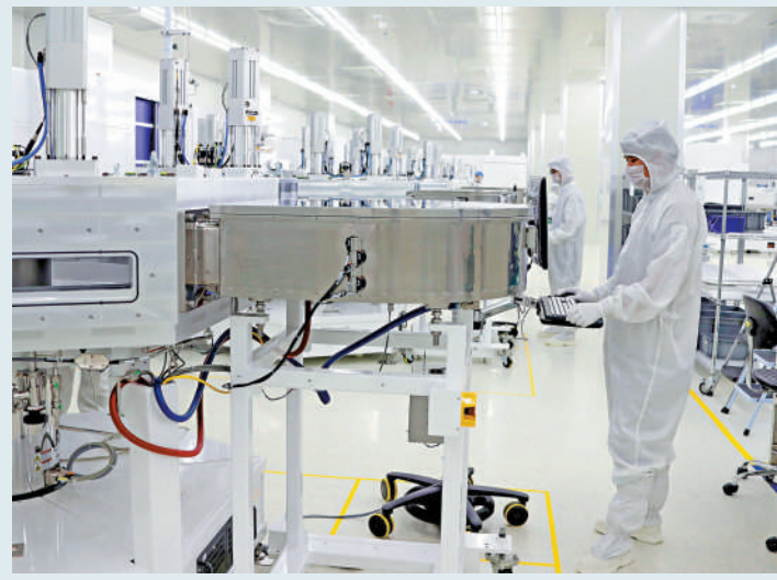
▲中微公司16日宣布，就被列入「黑名單」起訴美國國防部。圖為客商在展會參觀中微公司展位。資料圖片