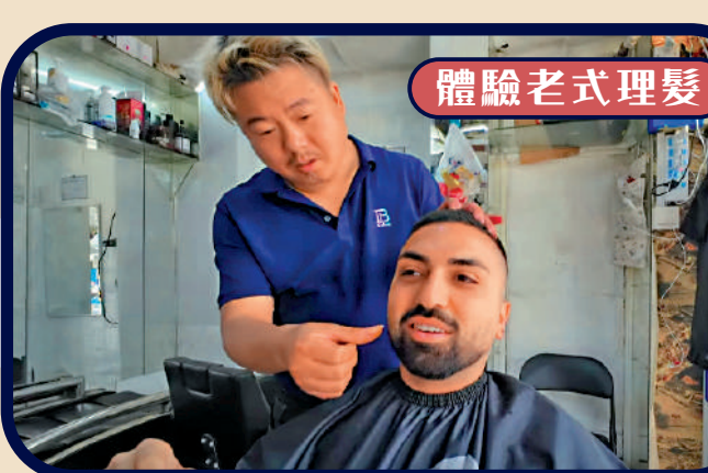
▲加拿大博主 [KSquared] 體驗中國傳統理髮廳。