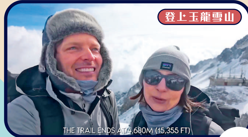
▲美國博主 [Gone with the Wynns] 對雲南麗江玉龍雪山的美景讚不絕口。