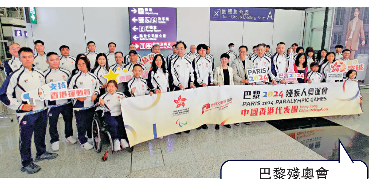
▲楊潤雄到機場為港隊打氣，並與運動員大合照留念。