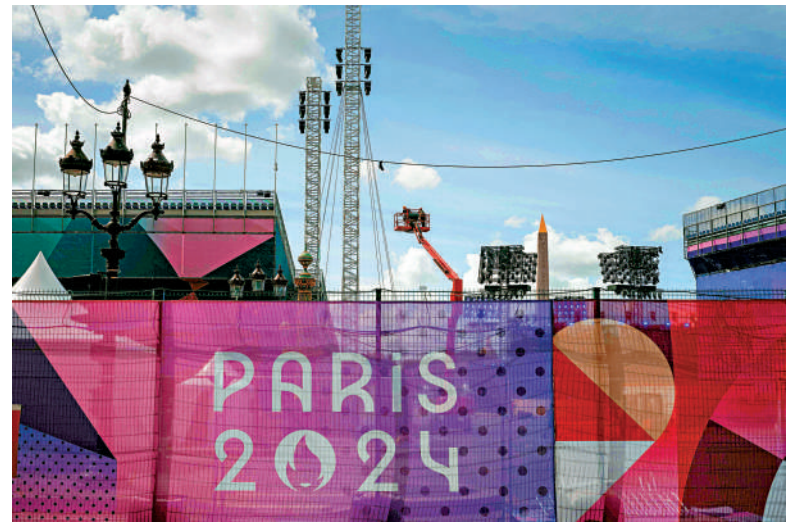
▲開幕式臨時看台進行最後施工。

法國藝術家祖利將繼巴黎奧運後再統籌殘奧開幕式，他保證帶來一場「前所未見的表演」：「這場演出將利用殘奧獨特的精神，團結所有現場和電視機前的觀眾，體現殘奧的核心價值。」 國際著名編舞家艾克民則會出任表演舞台總監，他透露今次是自己首次與殘疾舞蹈員合作，承諾向觀眾傳遞法國的包容性：「他們（殘疾舞蹈員）十分出色，不論在精神抑或身體層面上都比不少普通人更優秀。」