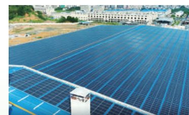
▲建滔陸續於工業園區建設太陽能光伏發電站，實現節能減排，減低電煤消耗，為環保出力。

集團專業及有系統地陸續於各工業園區及物業所有可建面積建設分布式太陽能光伏發電站項目；預算截至二零二四年十二月三十一日累計投資金額約9億港元，預計每年生產2億千瓦時綠色電力，相當於年節省能量5.4萬噸標準煤，可減少12萬噸二氧化碳排放，按市價計電費開支可節省1.8億港元。另外，截至二零二四年六月三十日，本集團累計已投資約1.5億港元於熱能回收設備，二零二四年上半年共減少2.5萬噸二氧化碳排放，相當於節省能量1萬噸標準煤，節省開支共8,000萬港元，加上截至二零二三年十二月三十一日累計節省開支共3億港元，截至二零二四年六月三十日累計開支共節省超過3.8億港元，持續為集團帶來長遠利益；河北醋酸項目採用清華大學環境學院開發的先進低能耗二氧化碳捕集技術，每年可捕集20萬噸二氧化碳，全部回用於醋酸生產系統，相當於年節省能量8萬噸標準煤，是目前全國化工行業最大燃煤煙氣捕集項目，該技術成果經鑒定為達到國際領先水準，實現了企業的綠色轉型，並反映集團致力實現環境、社會及管治(ESG)方面的可持續發展目標。（特刊）