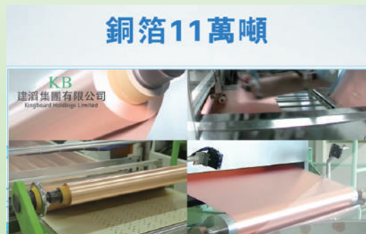
▲建滔每年生產銅箔逾11萬噸。

中央政府推行的提振電子產品需求的利好政策相繼落地，鼓勵和推動汽車、家電等消費品以舊換新。汽車電子化及智能化、AI行業持續高速發展以及高速網路不斷升級，均能刺激覆銅面板的需求，成為覆銅面板需求的主要增長動力。同時，集團大力打造覆銅面板研發中心，配備高精尖設備，集團已成功研發多種高頻高速產品可以應用於AI伺服器內的GPU主板，集團通過垂直產業鏈聯動發展，成功研發了應用於AI伺服器HVLP3銅箔、IC封裝載板用超薄VLP銅箔、210μm超薄低峰銅箔、4.5μm鋰電銅箔和2-3μm超薄載體銅箔。未來將能實現集團全方位覆蓋下游客戶的產品需求，並與優質客戶強強聯合，推動終端客戶對集團產品的認證。集團將於下半年於泰國增加覆銅面板產能每月40萬張，以配合海外客戶包括集團旗下印刷線路板部門海外業務的需求增長。