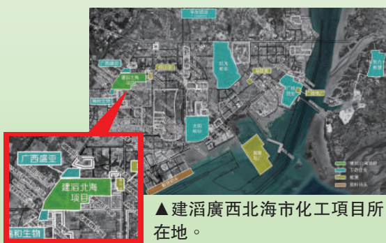
▲建滔廣西北海市化工項目所在地。

加強生態環境保護，推動發展方式綠色轉型仍是國家二零二四年的工作重點，化工部門將不遺餘力確保生產安全及排放達標。同時着力提升廠房效率，優化資源利用以降低能耗。集團於河北省邢台市籌建年產80萬噸的醋酸項目將於2024年年底投產，亦將採用清華大學環境學院開發的先進低能耗二氧化碳捕集技術。集團於廣西北海市籌建年產20萬噸的燒鹼項目將於2025年年底投產，於籌建的工業園區內已有足夠的客戶消化產能，所有燒鹼產品均可通過短途運輸或管道輸送節省運輸成本，而且燒鹼銷售均價相比衡陽地區每噸高出人民幣150至200元，市場優勢明顯。連同於廣東省惠州市大亞灣區年產45萬噸的苯酚丙酮項目已於2023年10月投產及年產24萬噸的雙酚A項目已於2024年6月投產，再加上以上位於河北及廣西的項目，集團於化工業務的版圖將進一步擴大。化工部門堅持以科技創新為引擎，推動企業轉型升級、綠色低碳高質量發展。