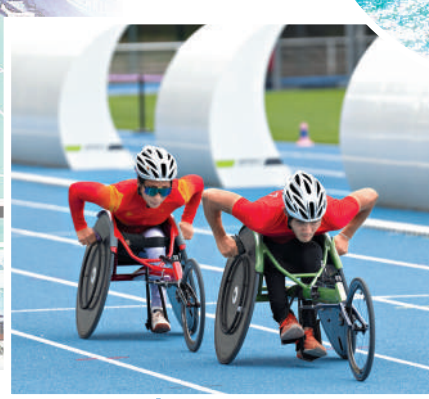
▲國家田徑隊輪椅競速組運動員在訓練中。