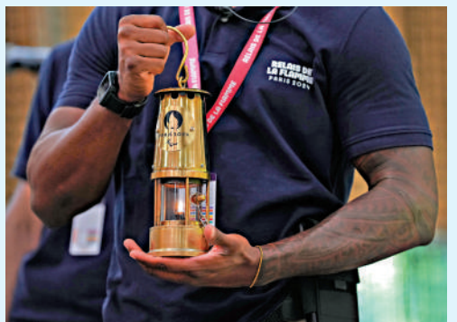
▲巴黎殘奧會聖火火種。

從1976年殘奧會起，夏季項目參賽者不再局限於脊椎損傷人士，而是增加了截肢、視力障礙等選手。1988年，國際奧委會規