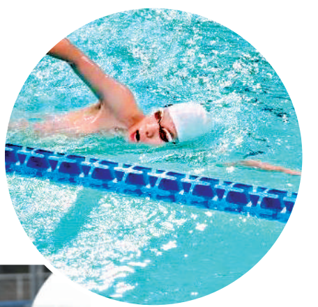
▲中國游泳隊選手賽前加緊練習。