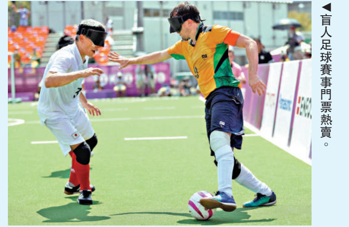
▲盲人足球賽事門票熱賣。

殘健融合的俱樂部也將是巴黎殘奧會為法國留下的重要遺產。「未來法國會有3000個俱樂部同樣為殘疾人提供服務。這些俱樂部中會有了解殘疾人健身需求的教練和體育老師。」帕森斯說。