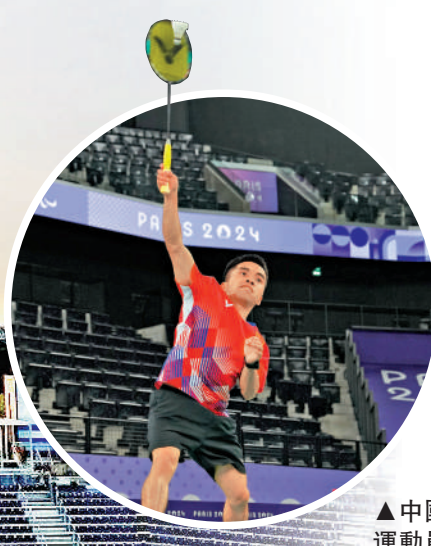
▲中國羽毛球運動員林乃利在訓練中。