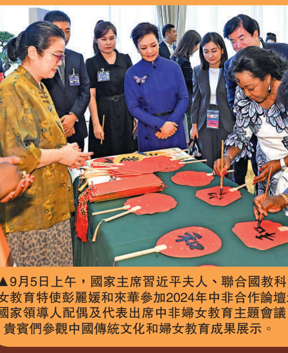
9月5日上午，國家主席習近平夫人、聯合國教科文組織促進女童和婦女教育特使彭麗媛和來華參加2024年中非合作論壇北京峰會的26位非洲國家領導人配偶及代表出席中非婦女教育主題會議。

在等候開幕式的空隙，有不少外國的拍攝位置。他們的服裝也非常隆重，除了正裝、皮鞋，就是穿著具有非洲民族特色的服飾。