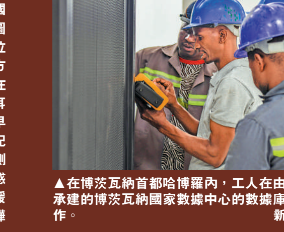
▲在博茨瓦納首都哈博羅內，工人在由中方承建的博茨瓦納國家數據中心的數據庫房工作。

在等候開幕式的空隙，有不少外國的拍攝位置。他們的服裝也非常隆重，除了正裝、皮鞋，就是穿著具有非洲民族特色的服飾。