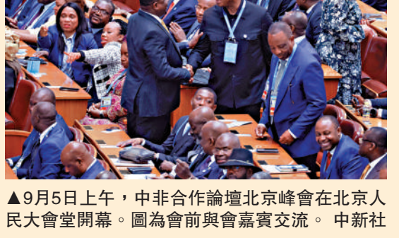
9月5日上午，中非合作論壇北京峰會在北京人民大會堂開幕。圖為會前與會嘉賓交流。

習近平會見聯合國秘書長古特雷斯時強調，踐行真正的多邊主義，支持聯合國在國際事務中發揮核心作用。