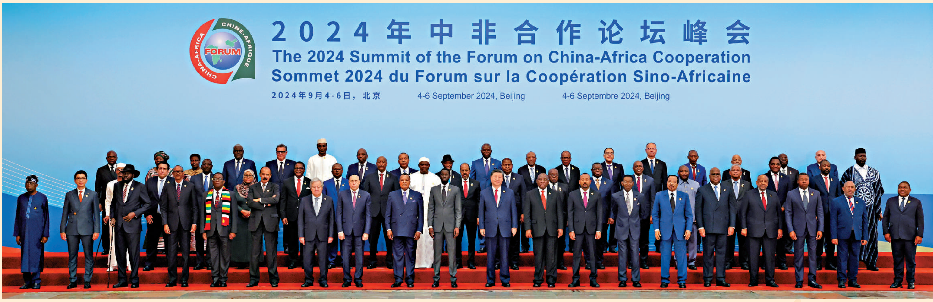
9月5日上午，中非合作論壇北京峰會開幕式在北京人民大會堂舉行。開幕式前，國家主席習近平同出席論壇峰會的外方領導人集體合影。