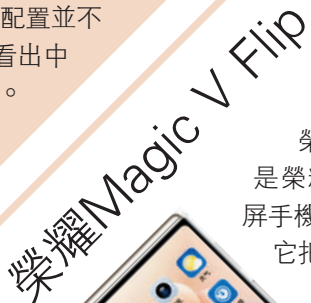
榮耀Magic V Flip

榮耀Magic V Flip是榮耀推出的首款小摺疊屏手機，雖然是第一代產品，但它把小摺疊外屏做到全面屏的理念讓整個行業眼前一亮。