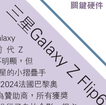
三星Galaxy Z Flip6

三星Galaxy Z Flip6與前代Z Flip5相比變化並不明顯，但也從一定程度上說明三星的小摺疊手機方案已經趨於成熟。在2024年法國巴黎奧運會的頒獎典禮上，三星作為贊助商，所有獲獎運動員都使用Galaxy Z Flip6進行了自拍合影，想必這也會幫助三星的小摺疊獲得更多全球消費者的喜愛。