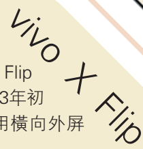
vivo X Flip

vivo X Flip是vivo在2023年初發布的產品，採用橫向外屏設計，主打自拍功能。而此後經過了一年多時間，vivo尚未推出一個版本的小摺疊產品。