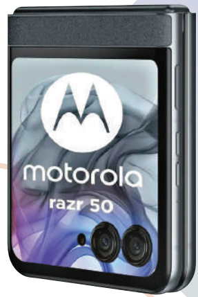
Moto Razer 50

Moto Razer 50系列摺疊屏手機經過了幾代的演進，已經逐漸成熟，早前遭人詬病的軟件適配問題也得到了解決，入門版的Moto Razer 50價格也非常親民。