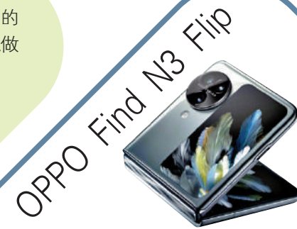
OPPO Find N3 Flip

OPPO Find N3 Flip也在經過了幾個不同方案的迭代後，最終採用了縱向外屏的設計，其外屏比例接近於直板手機，這樣能保證外屏的軟件兼容性和實用性，配以三顆後置鏡頭，定位於影像旗艦小摺疊。