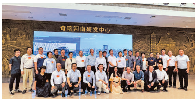
▲在河南，港區人大代表視察組視察奇瑞汽車開封生產基地。

中華文化的瑰寶瑰寶，而香港正致力於舉辦中華文化節，兩者可以攜手合作，共同打造以「宋文化」為核心的中華文化盛會。李聖濂代表表示，這次視察看到重建重振河南省科學院，也充分體現省裏對科技創新和產業培育的高度重視。但還要重視支持、引導創業投資、股權投資、產業投資，為產業騰飛插上金融的翅膀。