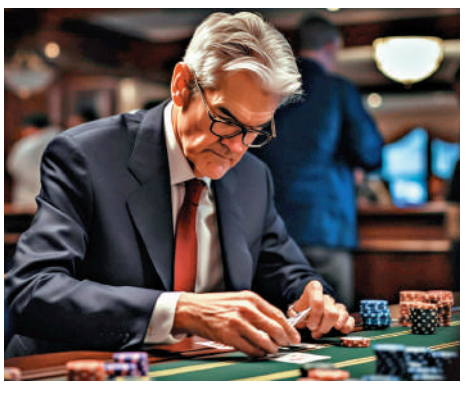
關於降息路徑，鮑威爾只交出「時間表」，卻沒畫出「路線圖」，大家還是看不到他手中的底牌。 大公報AI製圖

首先，住房通脹隨時反彈。目前美國30年按揭利率已降至6.4%後，低於7%的平均租金回報率，極大刺激了成屋與新屋銷售數據回暖。美國住房通脹數據通常滯後於房價走勢一年到一年半的時間，以去年上半年房價開始反彈作