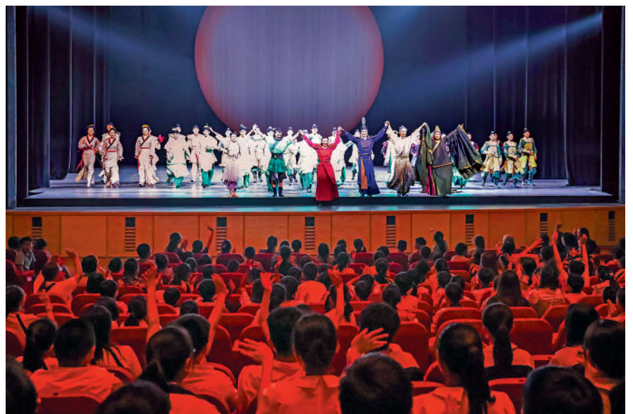
▲逾千名學生獲邀免費欣賞舞劇《花木蘭》的公開綵排。