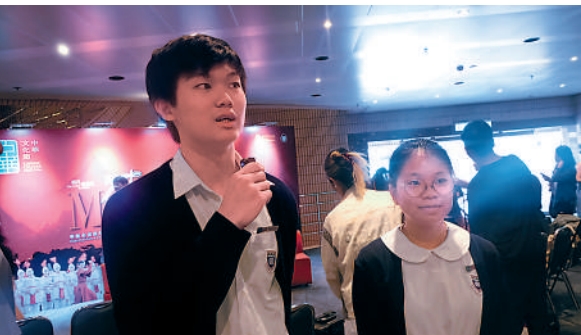
▶筲箕灣官立中學學生吳同學（左）與鄭同學（右）接受採訪。