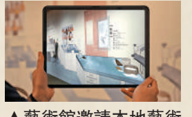
▲藝術館邀請本地藝術團隊XR Experience創作了一系列多媒體展示。