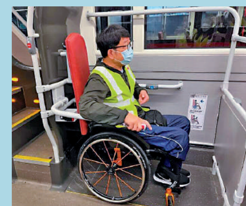
▲現時社區較以往增添不少無障礙設施，例如大部分巴士可接載輪椅。