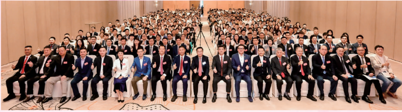
▲在慶祝中華人民共和國成立75周年暨「東江之旅、尋香之旅」惠州行發布儀式上，賓主大合照。

9月22日，慶祝中華人民共和國成立75周年暨「攜手同行 再創輝煌」惠州各縣（區）新動力成立和「共飲一江水 同為灣區人」香港青年「東江之旅、尋香之旅」惠州行發布儀式在香港舉行。中央政府駐港聯絡辦副主任何靖，惠州市委常委、統戰部部長賴建華，港區全國人大代表、新社聯會長陳勇，港區全國人大代表、工聯會會長吳秋北，全國政協委員、香港惠州社團聯合總會主席黃少康，第十三屆全國政協委員、香港惠州社團聯合總會會長楊勳，港區全國人大代表、香港惠州社團聯合總會執行主席、惠州新動力主席樓家強等出席並主禮，與近五百名港惠青年共同見證盛典。