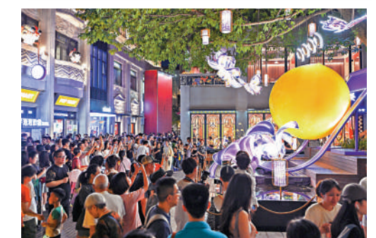
▲廣州加快建設成為中國式現代化城市新坐標。圖為中秋假期，永慶坊的月亮藝術裝置吸引遊客留影。