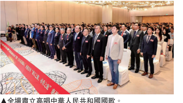
▲全場肅立高唱中華人民共和國國歌。